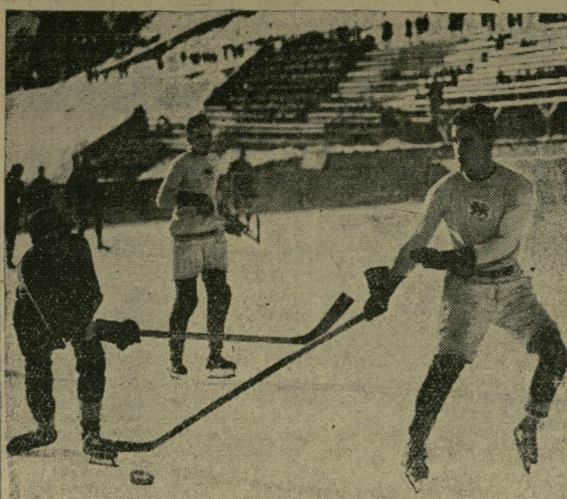
St. Moritz fué presa de gran excitación no hace mucho, durante el encuentro de "hockey" entre Oxford y Cambridge.