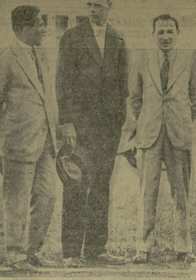
La fotografía actual muestra a tres figuras prominentes en el campo de la aviación. El primero de la izquierda es el teniente Dieudonne Costes, y el primero de la derecha, su compañero de viaje, el teniente Joseph Lebriz; en el centro aparece el coronel Charles A. Lindbergh.

iniciado un movimiento de opinión pública con el fin de que no se le obligue a extender los documentos manuscritos, como acaba de disponer la corte superior de justicia.