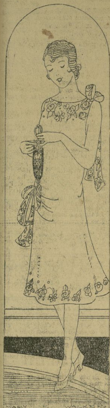
Traje de noche bordado.

Aun no desaparecen los fritos, todavía una brisa helada, se cuele por el cuello del abrigo indicando que de un momento a otro puede caer una última nevada y las vicisitudes de las modas muestran las primicias de las modas primaverales; ligeras sedas, velos vaporosos,