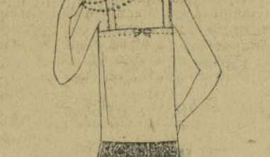
Vestido de calle para jovenzuela.

Número 6045.—Puede hacerse de muletón, o de pelo de camello y es muy cómodo para viajes o para llevar a la oficina debajo del abrigo de piel. El patrón se corta en 7 medidas a ser tallas: 34, 36, 38, 40.