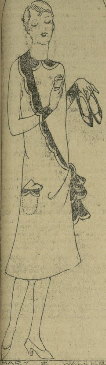
Calzado de raso recién pintado. Traje muy original, sencillo y elegante.

Hay que tener cuidado de que los colores que se usan no se rechacen entre sí; por ejemplo un zapato de raso color rosa, al teñirlo de azul quedará morado; un zapato color oro, al teñirlo de rojo, resultará anaranjado; si el zapato es azul y se quiere darle un color verde, se le pintará con anilina. Nunca deben usarse colores claros sobre un mate-