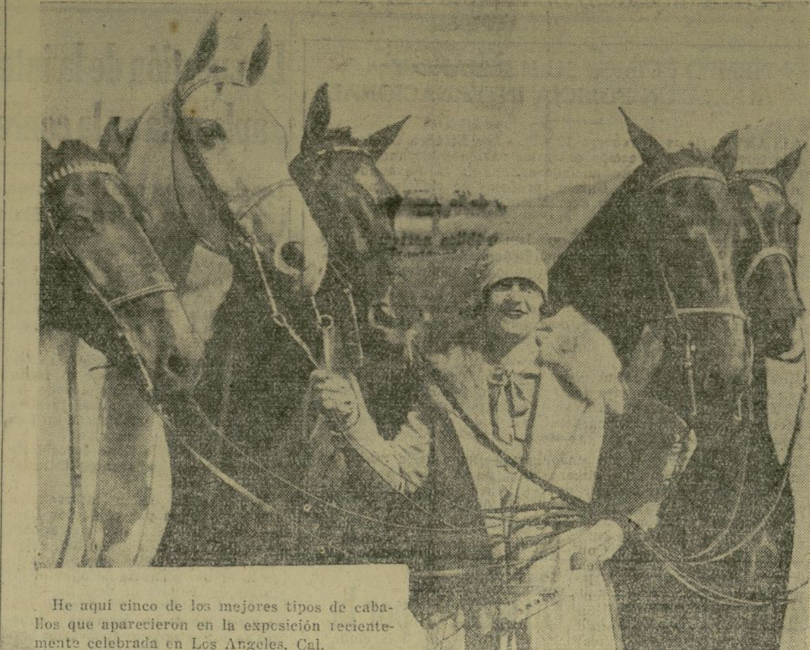
He aquí cinco de los mejores tipos de caballos que aparecieron en la exposición recientemente celebrada en Los Angeles, Cal.

COMERCIALES Y OBREROS, MILLONARIOS Y POBRES Forman la colonia hispana. Pida sus empleados por intermedio de las columnas de LA PRENSA de cualquier categoría que los desee.