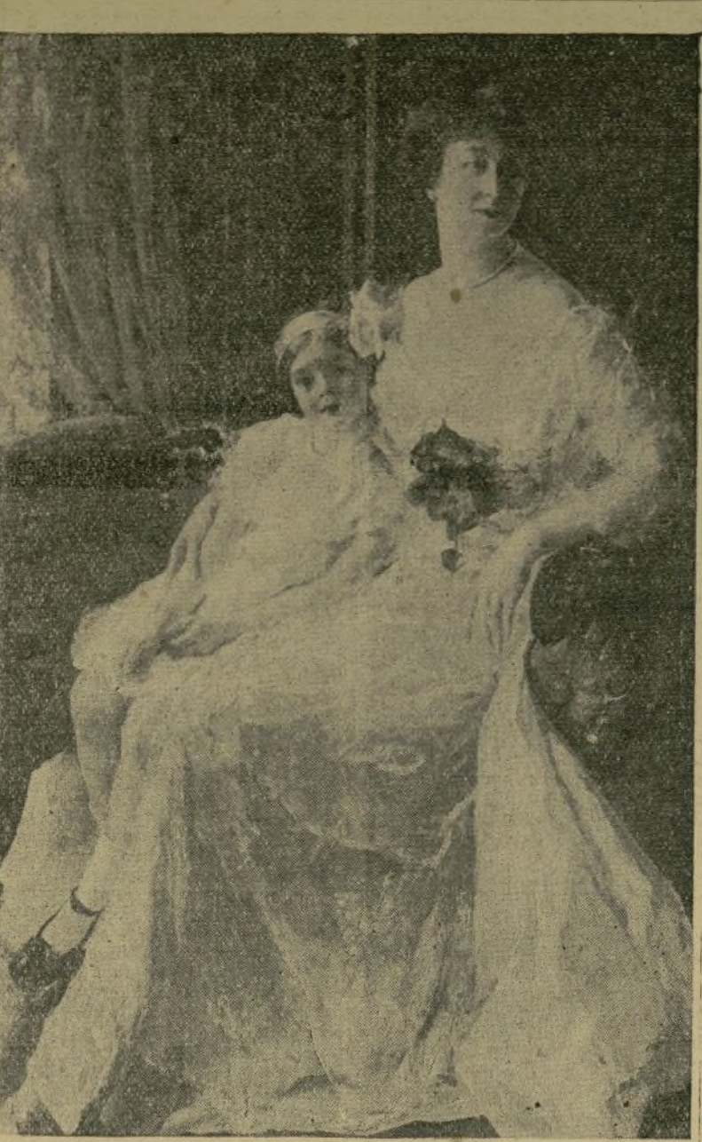
Retrato de una dama y su hija