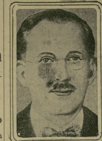
Doctor Juan Bautista Sacasa

Las maniobras fueron presenciadas por el presidente de la república, quien subió a bordo del "Garay", permaneciendo en él durante todo el tiempo que duraron.