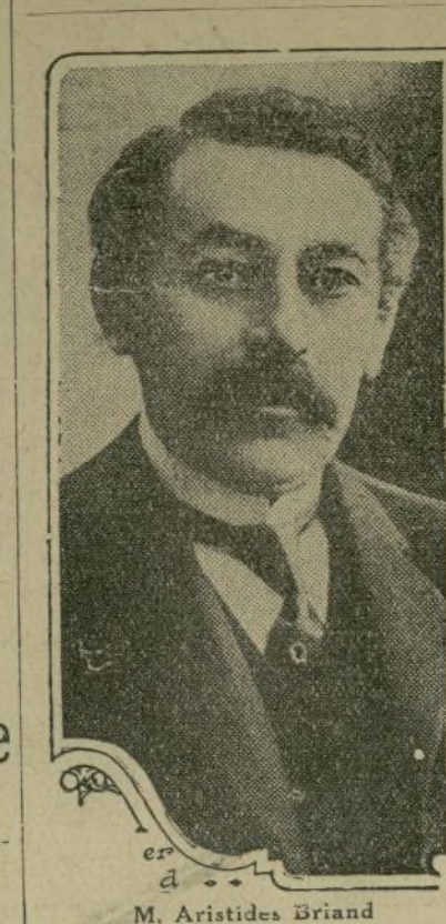
M. Aristides Briand