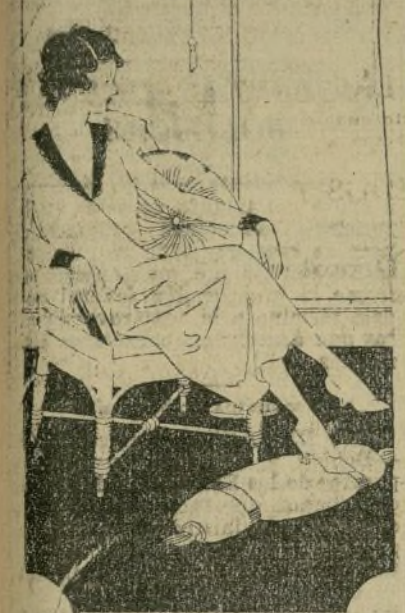
No se dirá que esta dama no tiene lindo el pie.

Una niña de mucho carácter y personal belleza, dijo una vez en la escuela refiriéndose a otra compañera poco atractiva: "Desprecio a ella que no saben caminar bien; tienen que ser débiles". Tenía razón en su juvenil y egoísta censura. Resentando la desgracia de una enfermedad irreparable, no hay razón para que todo el mundo no camine