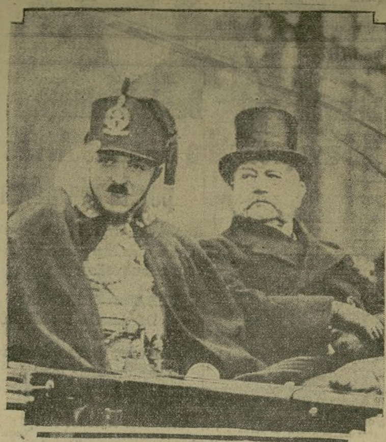
El monarca del Afghanistan, Aman Ullah, ha sido aclamado por las muchedumbres berlinesas. En esta fotografía aparece recorriendo las calles de la capital alemana acompañado del presidente de aquella república, Von Hindenburg.

por sus artistas. De entre aquellas tres se cuentan la de Madrid, fundada por Carlos III, y que es conocida como la "Estamparía Real", la fundada en Francia por Luis XIV, y la de Italia por el papa Clemente XII.