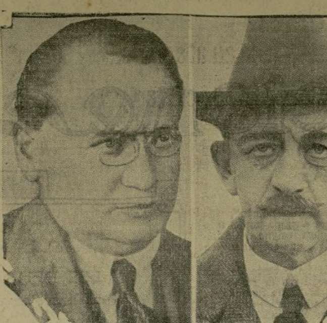
A la izquierda aparece Maxim Litvinoff y a la derecha el conde von Bernstorff, delegados de Rusia y Alemania, respectivamente a la Sociedad de las Naciones, sobre quienes cayó gran parte de la atención durante las últimas sesiones de la comisión del desarme debido a que parecían el delegado alemán, contra la costumbre establecida, rehusó apoyar las proposiciones pacifistas del delegado ruso. Se dice que la "lupata" entre los dos diplomáticos se debe a que recientemente seis técnicos alemanes fueron arrestados por el Soviet ruso en la región del Don, por considerarse implicados en un movimiento poco favorable para el régimen del gobierno ruso.

darle a usted la fe que necesita para creerla aún en los momentos en que pueda ser realmente sincero. Cuando se duda de la sinceridad de una persona, se le desestima, pues no es posible estimar a quien miente; no habiendo estimación, el amor no tiene follaje donde hacer su nido y por más que quiera aposentarse entre los muchos inhospitales, al fin se marcha desconsolado en busca de otro refugio. No se descorazona por lo que digo, pero guarde su amor para quien sepa apreciarlo; todavía es bastante joven para esperar al verdadero enviado del destino.