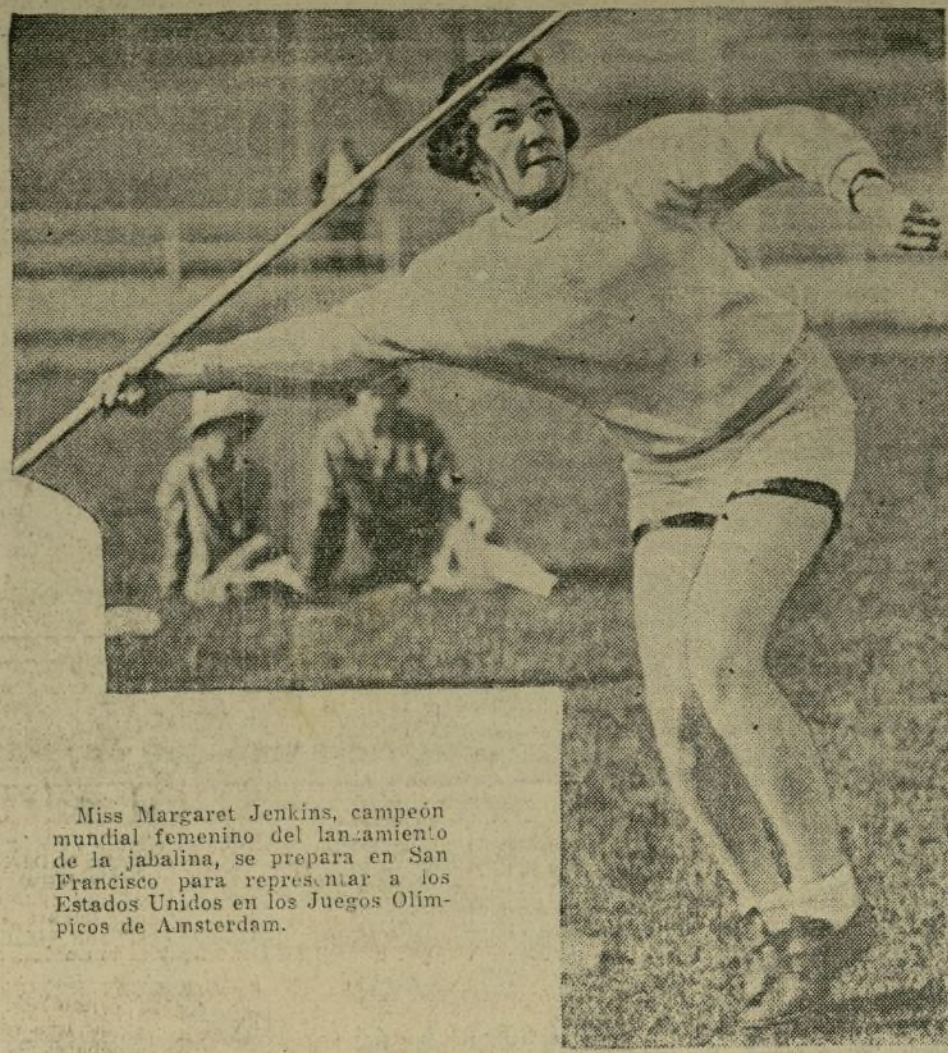
Miss Margaret Jenkins, campeona mundial femenina del lanzamiento de la jabalina, se prepara en San Francisco para representar a los Estados Unidos en los Juegos Olímpicos de Amsterdam.