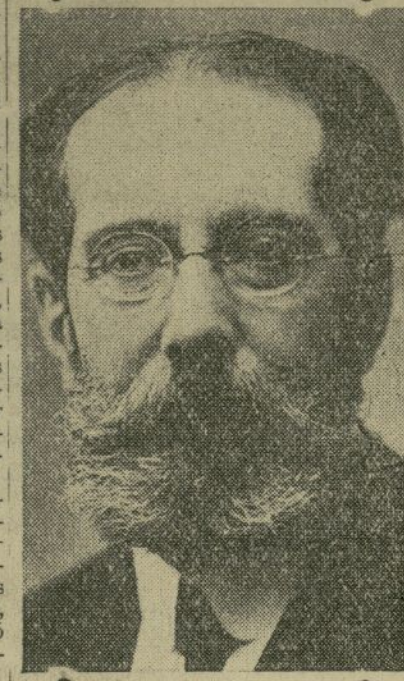
Sr. Enrique Fernández Arbós