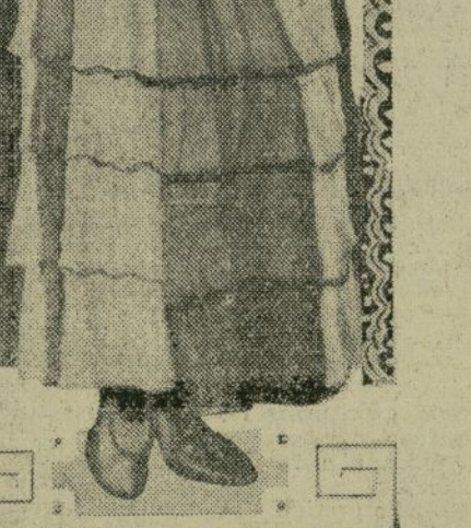
Este estuchito de primores que se Uana Essie Moore es una de las grandes razones del éxito de la gran producción.