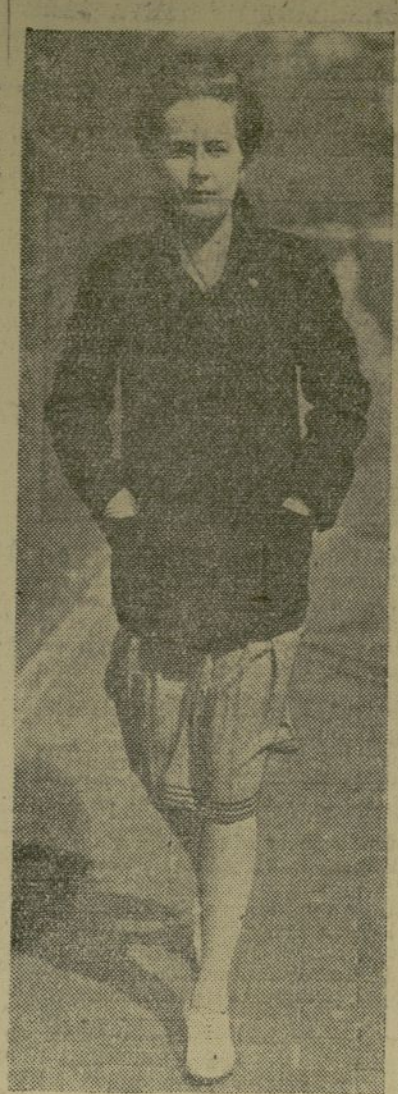
M.ª. William H. Vanderbilt, de New York dice que lo más adecuado para los deportes de primavera es una chaqueta de caballero.