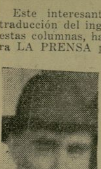
Federico de Onís Profesor de Columbia University

y nuevos libros, de poemas ya conocidos, aparecen continuamente en el campo literario; esta producción, en el mundo hispánico es de tan abundante y de tanto interés que, hace imposible que podamos seguir y conocerla si no se la considera agobiadamente.