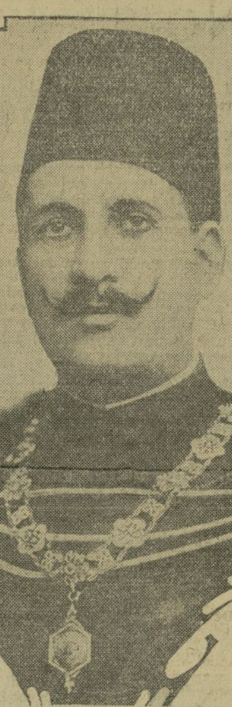
Se dice que el rey Fuad I, Egipto, está proyectando una visita a los Estados Unidos.