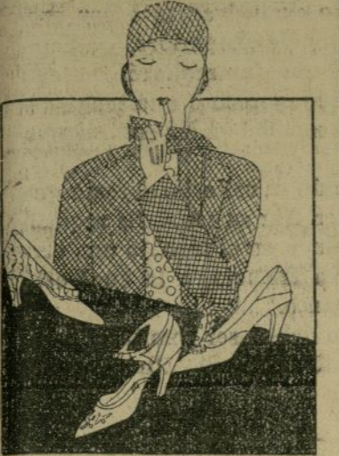
De la elección del calzado, depende muchas veces la elegancia de la "toilette".

toilettes de primavera. Mil telas diferentes ofrecen para confección de trajes de primavera: muselinas, velos, crepés, tafetas, gasas, encajes, y aun lanas delgadas combinan con encajes y bordados.