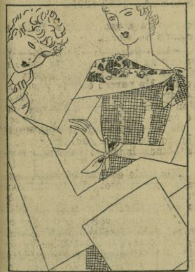
Los pañuelos en torno del cuello son cada día más fantásticos.

Los guantes en esta época, deben ser también de medida un poco mayor a la que se usa en invierno, para que sea efectiva la libertad de movimientos y la necesaria desentoladura y ligereza. Con el mismo fin se suprimirán las fajas de elástica.