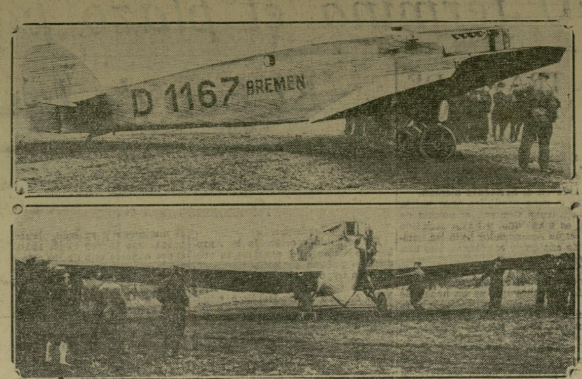
Pocos momentos antes de partir en su memorable vuelo, fueron tomadas estas dos fotografías del "Bremen", las que claramente dan una idea de su proporción y de su forma esbelta.

por íntimos amigos que se encuentran aquí.