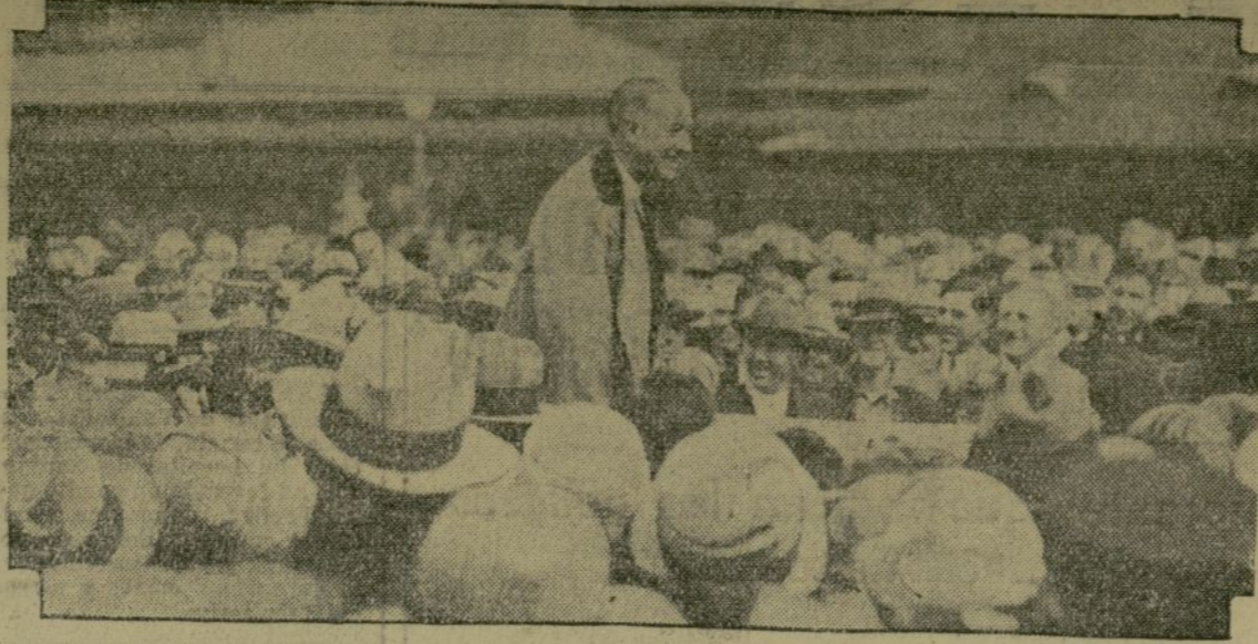
Un enorme gentío aclamó al gobernador del estado de New York, Alfred E. Smith, cuando éste llegó a Asheville, N. C., donde piensa pasarse unos días de "vacación."