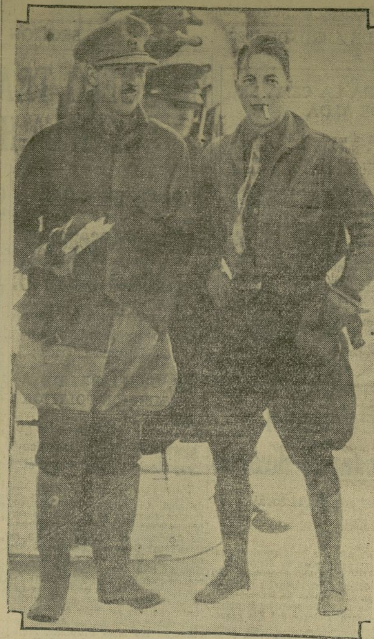
El commandant Fitzmaurice aparece en esta fotografía en el momento en que abandonaba el hidroplano en que hizo el viaje de la isla Greenely a Murray Bay, y el que fue pilotado por Duke Schiller, quien aparece a la derecha en la fotografía.