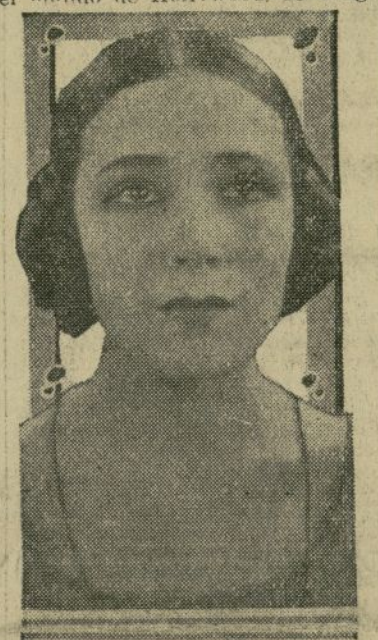
Dolores del Río

LOS ANGELES, abril 20.—Dolores del Río, la famosa estrella cinematográfica mejicana que tan rápidamente se ha elevado a la cima del mundo de Hollywood, se dirige