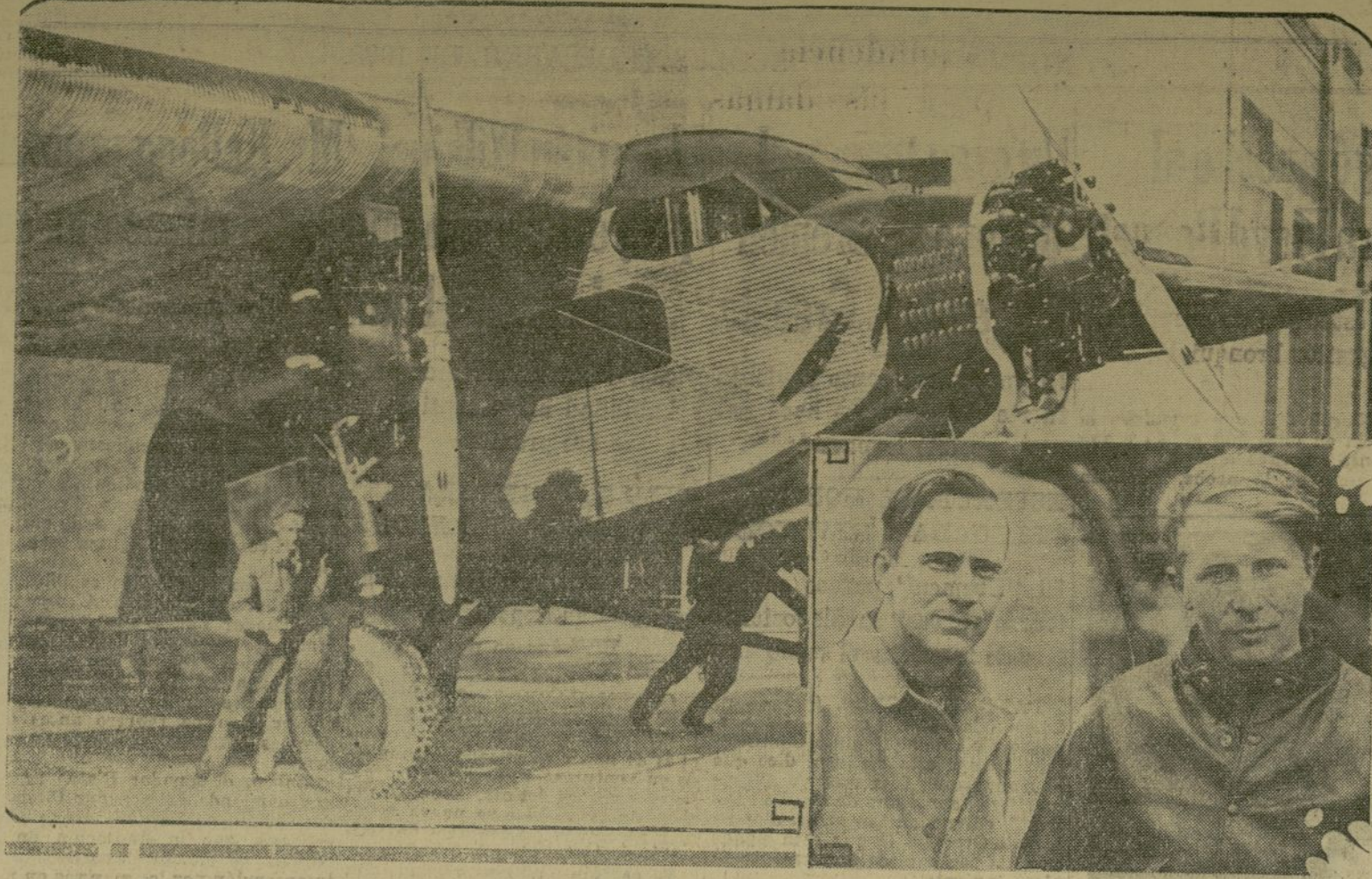
Después de haberse visto demorado por algunos días en St. Agnes a causa de la enfermedad que sobrevino a sus tripulantes, Floyd Bennett (izquierda) y Bernt Balchen, el "Detroit" partió rumbo a las islas Greenely tan pronto como Balchen mejoró un poco, llevando piezas de repuesto para el monoplano trasatlántico "Bremen".