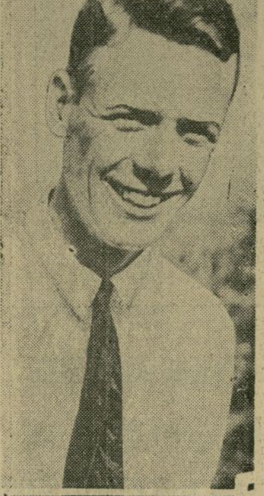
Coronel Charles A. Lindbergh

En el aeroplano junto con el suero, van tres bultos blancos que los que van en el avión apague, el mensajero del Instituto Rockefeller que trajo el suero, dijo que los pajaritos eran para ser usados en conexión con el suero, pero la forma en que esto se hacía era una cosa que no supo explicar. (Sigue en la 2a. pág.)