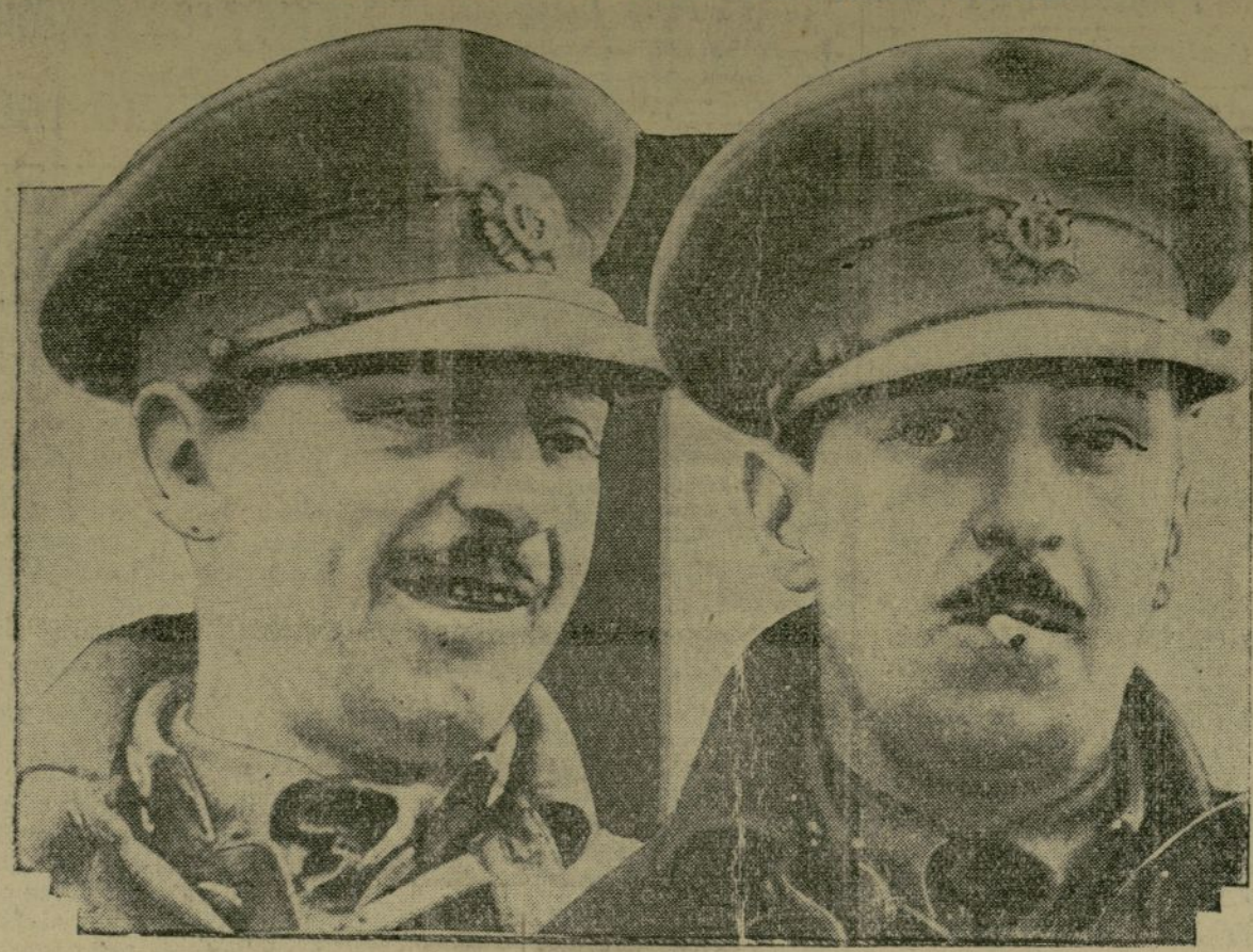
Estas dos fotografías del comandante James Fitzmaurice fueron tomadas en Murray Bay, momentos antes de él volver a salir rumbo a la isla Greenely.