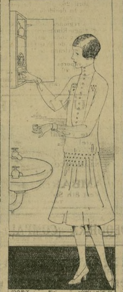
Unas cuantas gotas del perfume favorito, vertidas en el agua para lavarse, son parte del buen gusto.

Si difícil es el arte de reír bien, menos accesible aun lo es el de saber sonreír. Hay sonrisas enigmáticas, otras señalan, el rojo rubor de una ironía o el parentésis gris de un desencanto. Unas sonrisas son visiblemente; otras reflejan la amargura que anida en el alma. Hay sonrisas blancas, como el corazón de un niño, rosadas como la ilusión de una