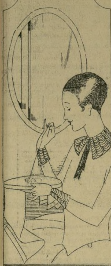
Una dulce sonrisa pliegan ejecuta el trabajo que le da el encanto más grato y éste más sabroso.

París ha empezado a lanzar la moda de perfumarse con esencia