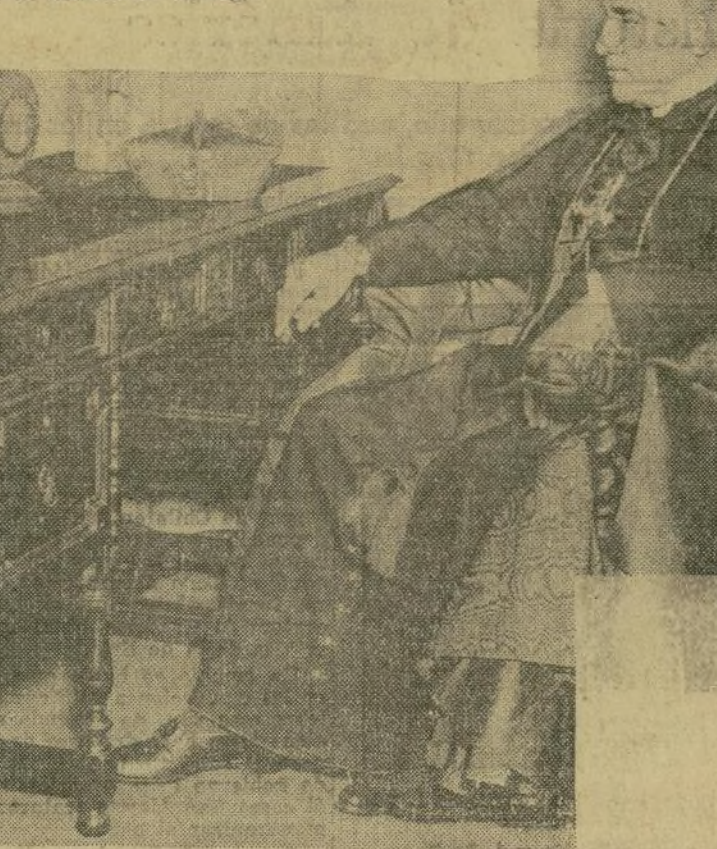
El cardenal Hayes se muestra muy contento y satisfecho de poder aprovecharse de los adelantos de la ciencia para dirigirse a sus feligreses sin tener que someterse a las inconveniencias de abandonar su hogar.