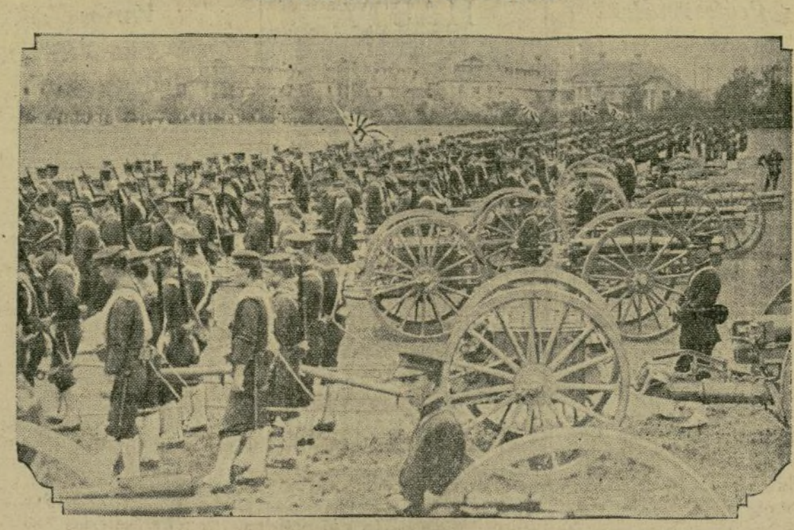
A la voz de "a proteger sus intereses" en la provincia china de Shantung, el Japón hace alarde de su poderío militar, enviando de continuo refuerzos para que protejan el ferrocarril japonés de Tsin-tao contra los ataques de los nacionalistas chinos.