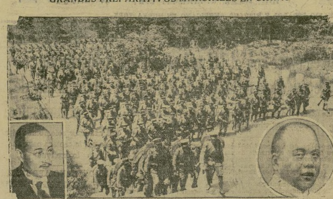
Esta fotografía presenta un pelotón de soldados japoneses dedicados a prácticas militares en China, en la provincia de Shantung. En el ángulo de la izquierda aparece C. T. Wang, prominente político chino, quien se dice es el alma ahora del movimiento nacionalista chino en Shantung, y en el extremo de la Guerra Japonesa, a quien se encomendó el mando de las fuerzas japonesas en China.

lantan las excavaciones que se están realizando en la villa romana descubierta en Villaverde, cerca de Madrid. Hasta ahora las excavaciones han dado por resultado el descubrir que las ciudades son dos en lugar de una, estando una superpuesta sobre la otra. Se han descubierto numerosos mosaicos, restos de construcciones, huesos, armas, cerámica, etc. Todos los artículos datan del siglo dos de la Era Cristiana.