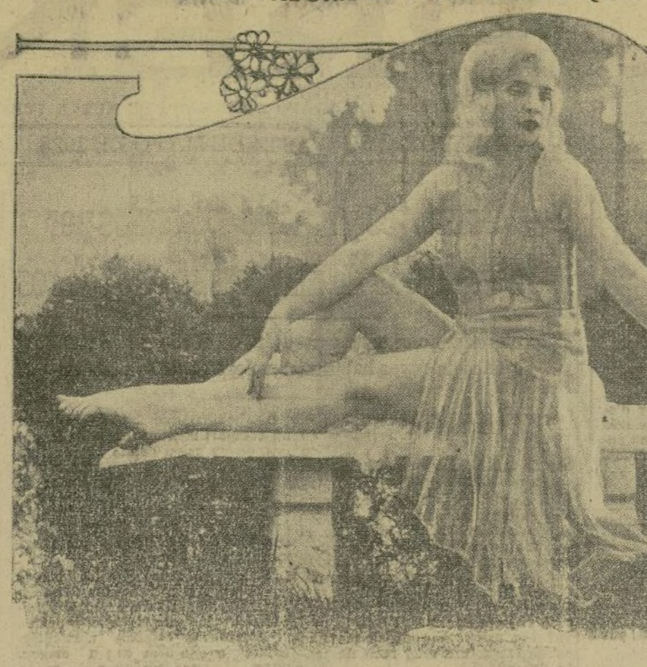
Esta bella estrella teatral griega pudiera ofrecer la necesaria inspiración a más de un poeta que anda a caza de "ideas" para componer algún original poema moderno.