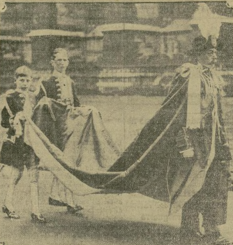
Esta fotografía de Jorge V de Inglaterra, fué tomada en el momento en que presidía una ceremonia de "Caballeros del Baño" (Knights of the Bath.)