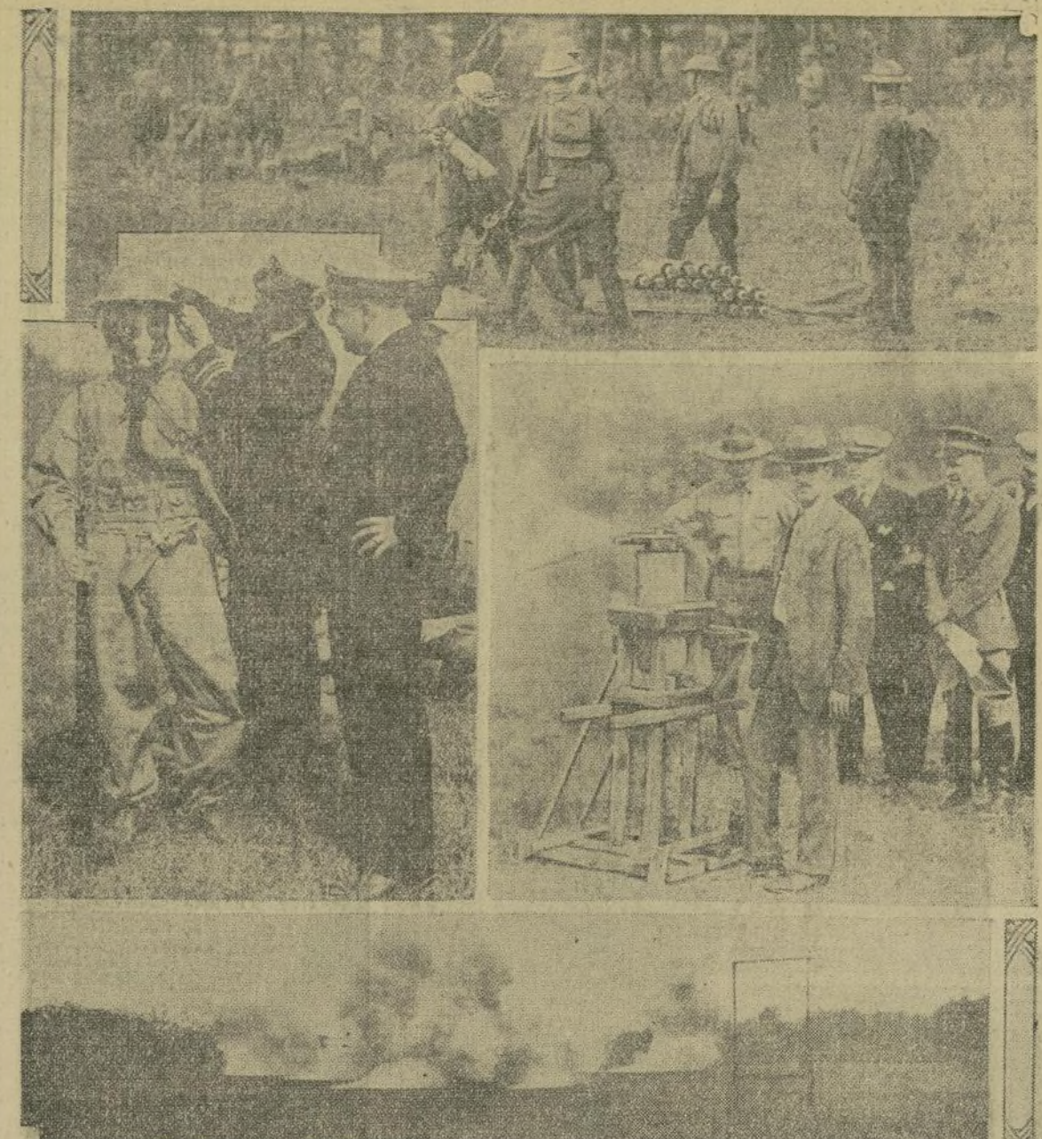
Estas fotografías presentan algunos detalles de prácticas realizadas últimamente por militares de los Estados Unidos en Edgewood, Md., con gas asfixiantes. En la parte superior aparecen ejercicios de tiro con ametralladoras lanza proyectiles gaseos.