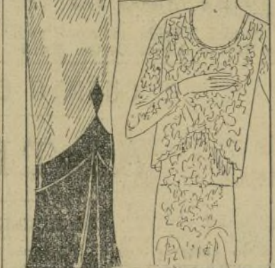
amplia, con un delgado doblad en la orilla.