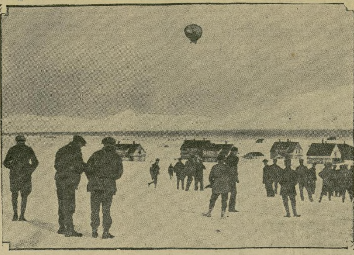
Continúa en el mayor misterio el paradero del dirigible "Italia" y sus tripulantes. Esta vista de las regiones polares da una vaga idea de los riesgos que pudo haber corrido la desgraciada nave al ser víctima tal vez de corrientes de aire contrarias.