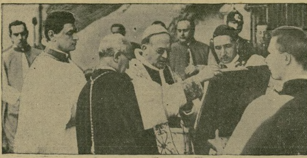
to en que bendecía las ceremonias de colocación de la primera piedra del "Colegio para la Propagación de la Fe."

comercio de Cuba en el Canadá, se dirigirá a dicho lugar en breve, llevando especiales órdenes de hacer lo posible para abrir un mayor campo al comercio entre el Dominio del Canadá y la república cubana.