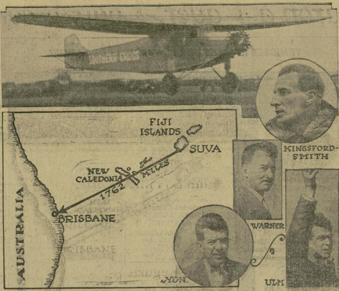
El monoplano "Southern Cross," con sus cuatro tripulantes a bordo, logró ser el primero en volar desde Estados Unidos a Australia.