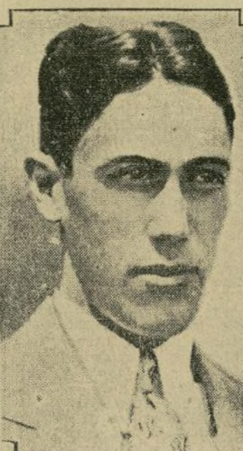
Capitán Emilio Carranza