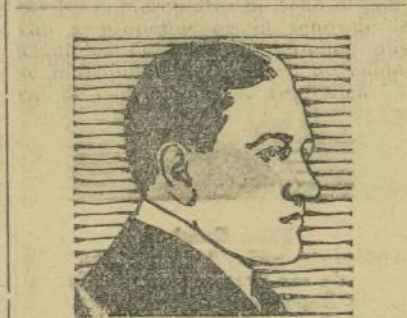
MIGUEL FLEITA (Tenor español)

AGENCIA TREN CIUDAD DE MEXICO. —Antes de que se abra la cuarta asamblea extraordinaria de la Confederación de Cámaras de Comercio, la cámara del estado de Coahuila, más significada, que lo que es la de la ciudad de Saltillo, ha convocado a una asamblea especial a las agrupaciones comerciales de esa entidad, con el fin de poner a sus delegados de acuerdo sobre las iniciativas que se presentarán en la Confederación de Cámaras. Como los delegados a esta asamblea local de Coahuila consideran que es de todo punto indispensable que se agrupen en Cámaras los comerciantes de todo el país, van a proponer en el seno de la asamblea de la Confederación que se multiplique el número de cámaras de comercio en la república.