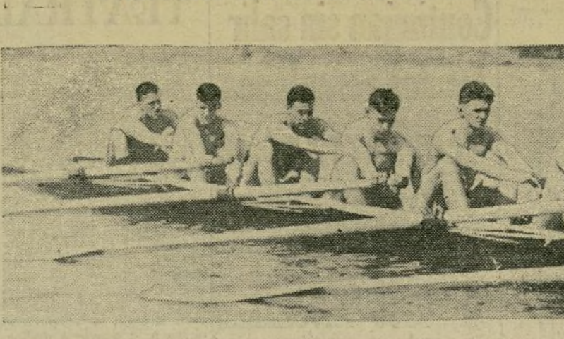
El equipo "varsity" de la Universidad de Columbia en pleno "training" en las aguas del Hudson para sus próximas grandes regatas