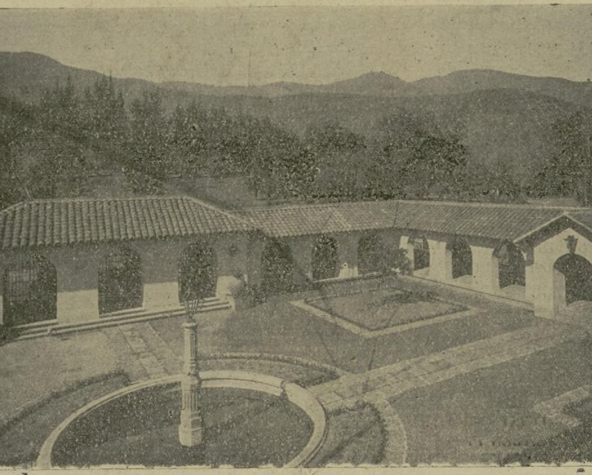
Patio de la Hacienda de San Isidro, Quillota, Chile.

Los extranjeros que han vivido en Chile lo bastante para comprenderse con las costumbres del país, están unánimes en declarar que las mejores mansiones de la república se encuentran no en la capital, ni en las ciudades, sino en las haciendas.