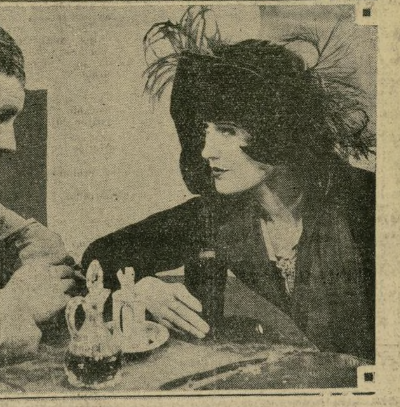
Richard Barthelmess interpreta en "The Wheel of Chance" uno de esos papeles que tan bien se adaptan a su arte. En esta escena de la misma aparece con Margaret Livingstone, quien encarna la parte de la causa de todos sus pesares.