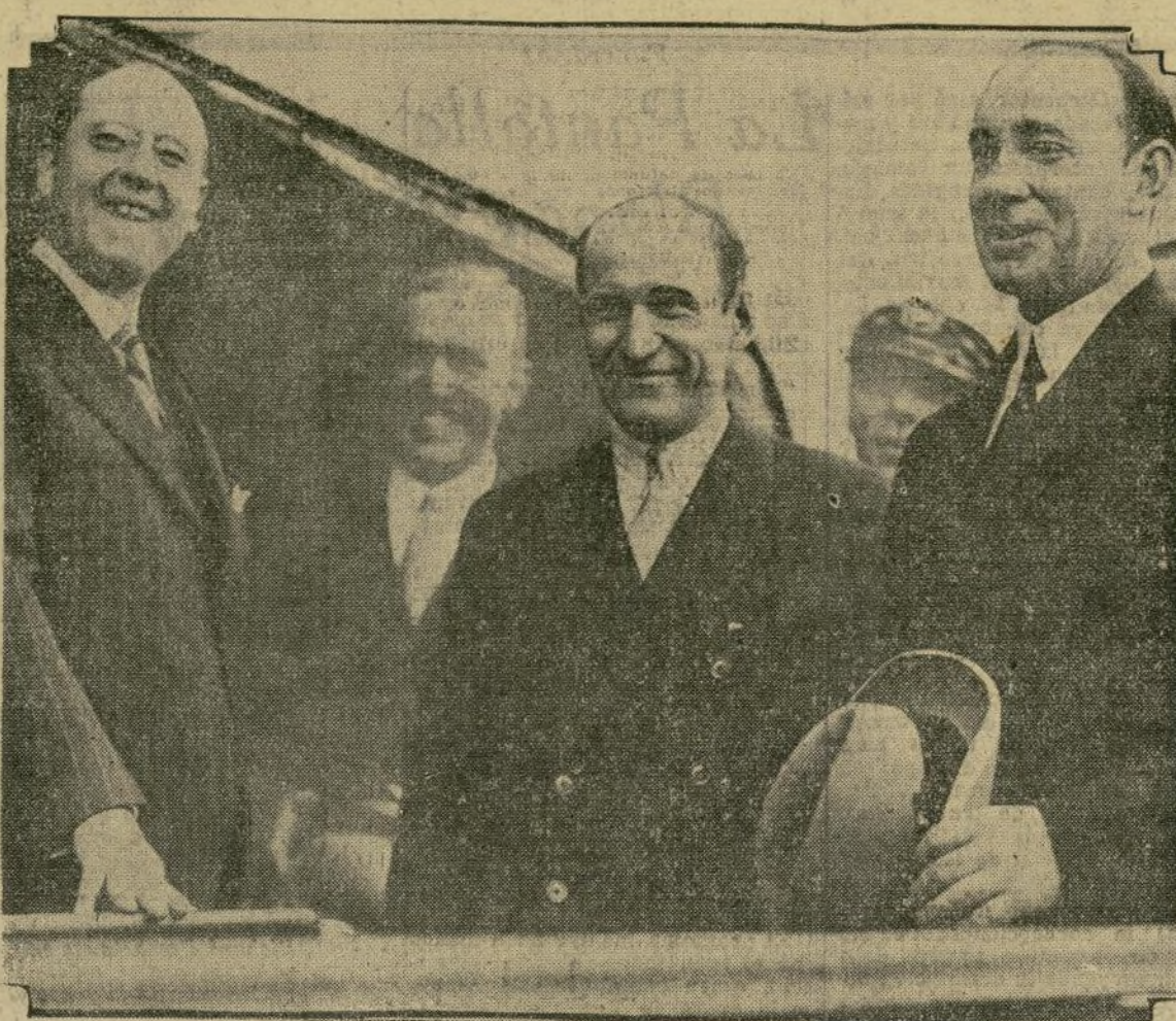
A su llegada últimamente a New York, el capitán Sir George Wilkins (derecha) y el teniente Carl B. Eilson fueron recibidos por las autoridades de la ciudad con los honores a que su hazaña les hizo acreedores. A la izquierda aparece Mr. George Mand, del comité de recepción.

buena marcha de las sociedades anteriormente constituidas; sino que, al contrario, el Centro Aragonés, será una sociedad que fomente continuamente la fraternidad y la armonía, y contribuirá con todo su esfuerzo a todas aquellas obras de patriotismo y de interés general que aporten algún beneficio moral o material a la colonia hispana, laborando por su mayor prestigio, y contribuyendo por todos los medios a su alcance a un mutuo conocimiento y al establecimiento de una amistad más íntima y más sincera, entre todas las asociaciones de nuestra raza establecidas en esta ciudad.