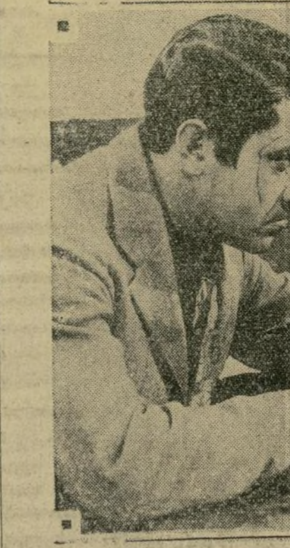
Richard Barthelmess interpreta en "The Wheel of Chance" uno de esos papeles que tan bien se adaptan a su arte. En esta escena de la misma aparece con Margaret Livingstone, quien encarna la parte de la causa de todos sus pesares.

Hizo observar que en la Java holandesa se ha permitido a los nativos arrendar, pero no vender sus tierras, y se basa en que los Estados Unidos en su negligencia para hacer tales provisiones, "estaban en el deber de ayudar la masa puertorriqueña."