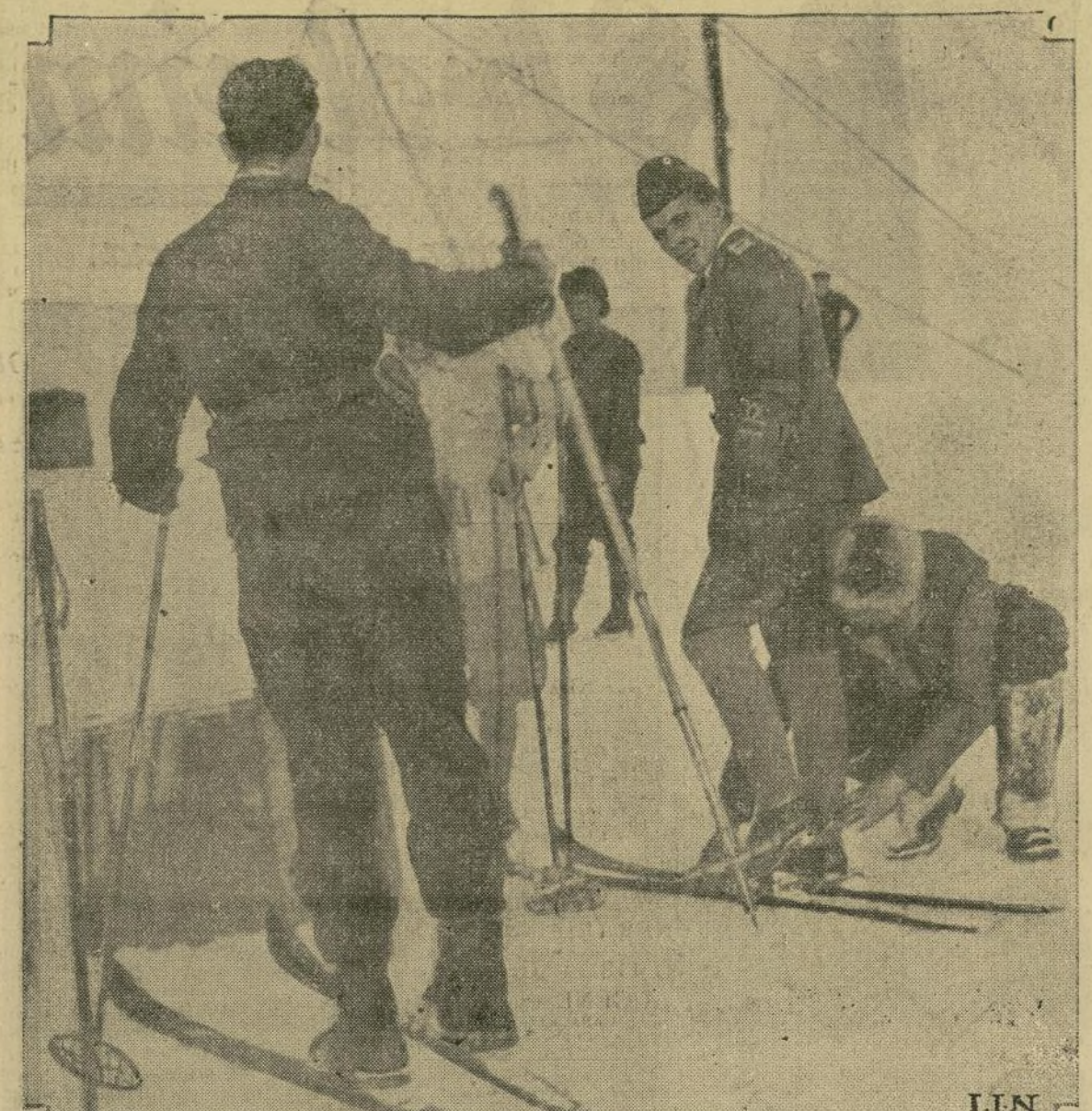
Esta fotografía del general Nobile fue tomada en los días en que aquí se encontraba preparándose para el desgraciado vuelo sobre el Polo Norte, cuando en ratos de ocio se dedicaba al deporte de los skis.