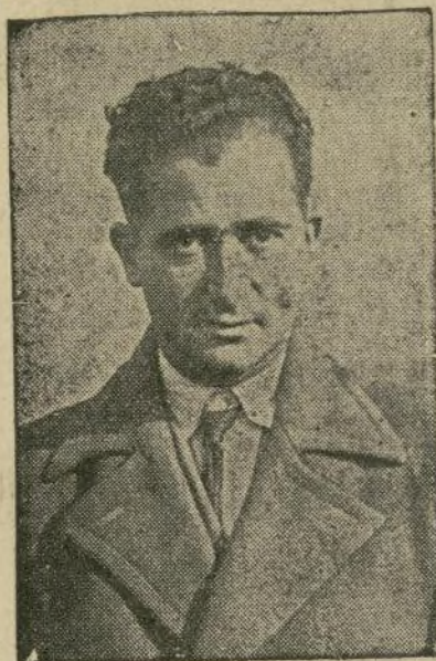
Comandante Ramón Franco

CADIZ, julio 29. (A.P.).—Por segunda vez el comandante Ramón Franco, as español, tiene pendientes de probar sus hazañas los corajes hispanoamericanos, que palparán