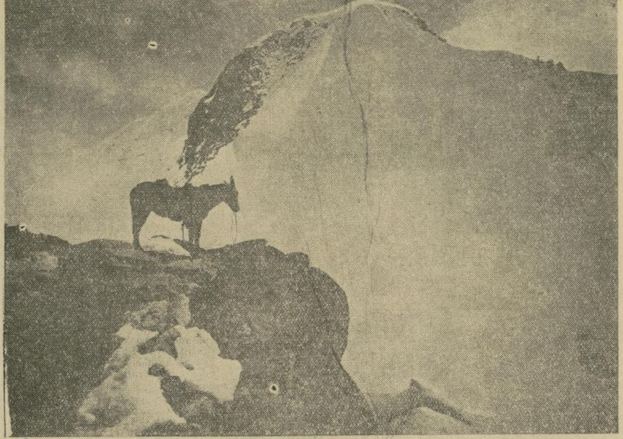
Bolivia. Las montañas eternamente nevadas han visto a la república el justo sobrecumbre de la Suiza Sudamericana.

interna y externa del naciente estado. En los primeros años de vida libre, la república de Bolivia sufrió continuos contratiempos e infortu-