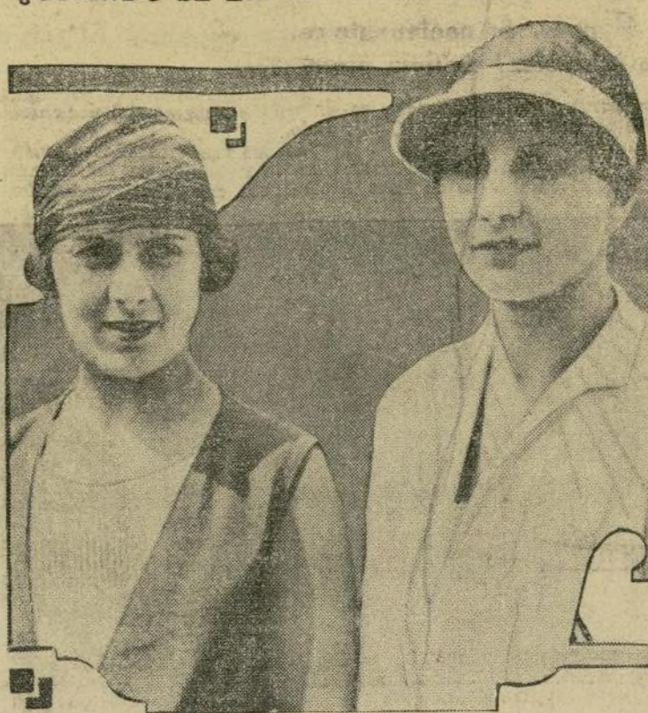
Miss Helen Wills y la señorita Lily de Alvarez representan en el tenis femenino lo que en el masculino W. T. Tilden y René Lacoste. Recientemente se enfrentaron en Wimbledon, triunfó Miss Wills después de un reñido "match". ¿Cuándo será la próxima?

den allá hasta que lo aprendan y después vengan. Los nacidos en Sur América están libres de cuota, pero no su padre quien tendría que entrar dentro de cuota. Usted es legalmente mayor de edad y puede recibirlos.