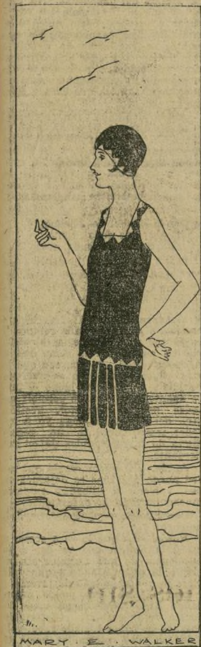
MARY E. WALKER

Uno de los atractivos que tiene la vida en el verano, ya sea en las montañas o en alguna ciudad, es el cambio y la diferencia en el modo de vivir. Hay personas que gustan acortar estas diferencias, por disfrutar el encanto de la variedad, entre el lujo y la etiqueta de la gran ciudad y la simplicidad con