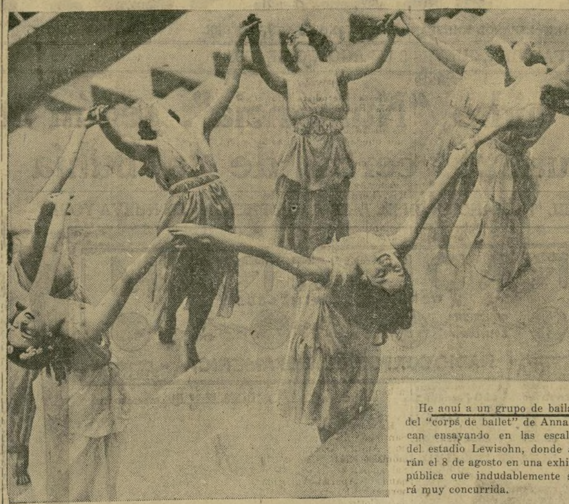
He aquí a un grupo de bailarinas del "corps de ballet" de Anna Duncan ensayando en las escalinatas del estadio Lewisohn, donde actuarán el 8 de agosto en una exhibición pública que indudablemente se verá muy concurrida.