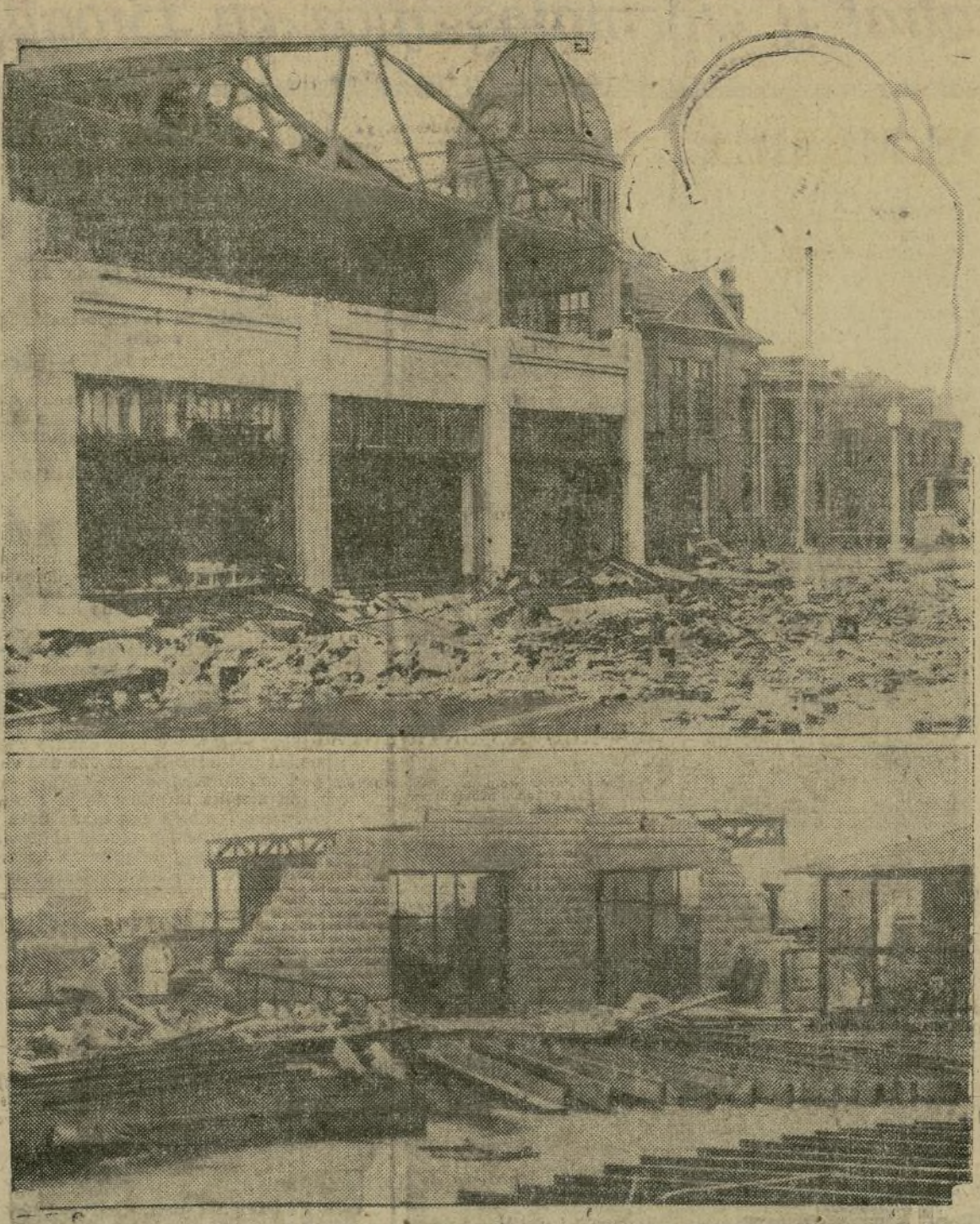
Esta doble fotografía, tomada en Fort Pierce, uno de los lugares de la Florida que más han sufrido a consecuencia del reciente huracán, da una idea de la violencia con que sopló en algunas regiones.

subscripción a beneficio de la casa de socorros: