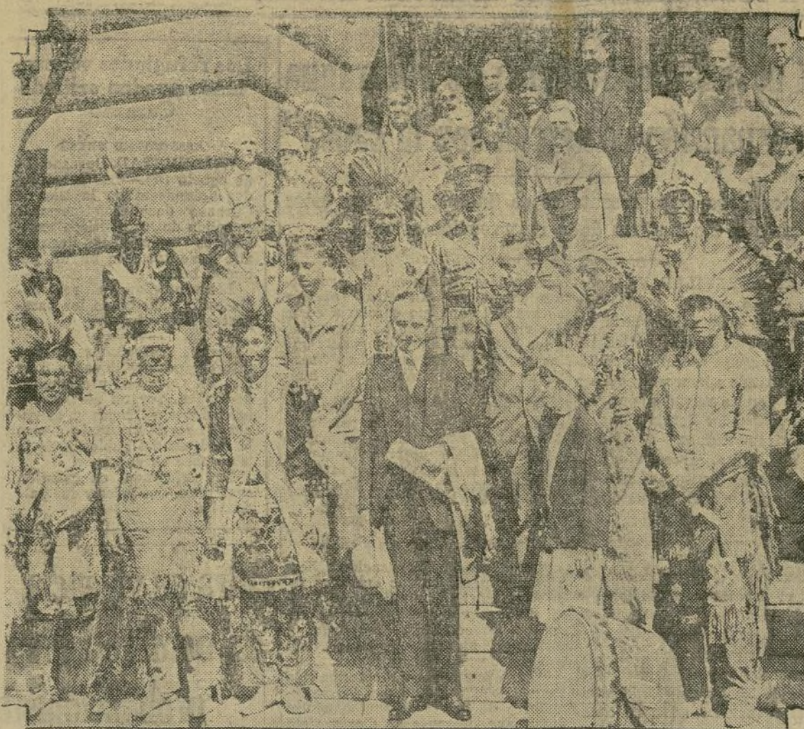
Un grupo de indios de las reservas de la tribu de los Chippewa, de Wisconsin, acudió recientemente a visitar al presidente en Superior Wis., donde se celebraron brillantes ceremonias, peculiares de esta raza de aborígenes del continente americano.