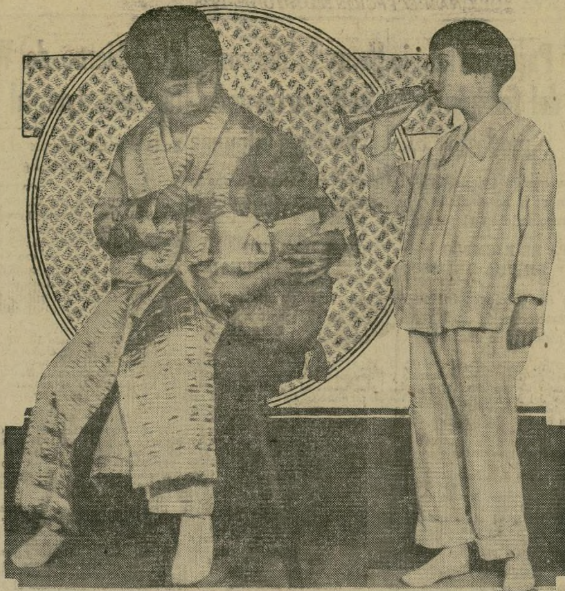
Se nos dice que éstos son los últimos modelos llegados de París para trajes de noche para los niños. Muy bonitos, ¿verdad?