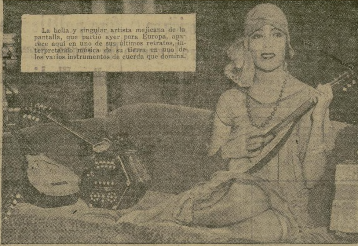
La bella y singular artista mejicana de la pantalla, que partió ayer para Europa, apareció aquí en uno de sus últimos retratos, interpretando música de su tierra en uno de los varios instrumentos de cuerda que domina.