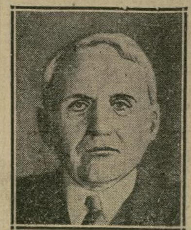
Frank Billings Kellogg

Hoy en la madrugada, partió rumbo a Europa a bordo del transatlántico francés "Ile de France", el secretario de Estado de los Estados Unidos, Mr. Frank Billings Kellogg, quien se pondrá en camino con los representantes de catorce na-