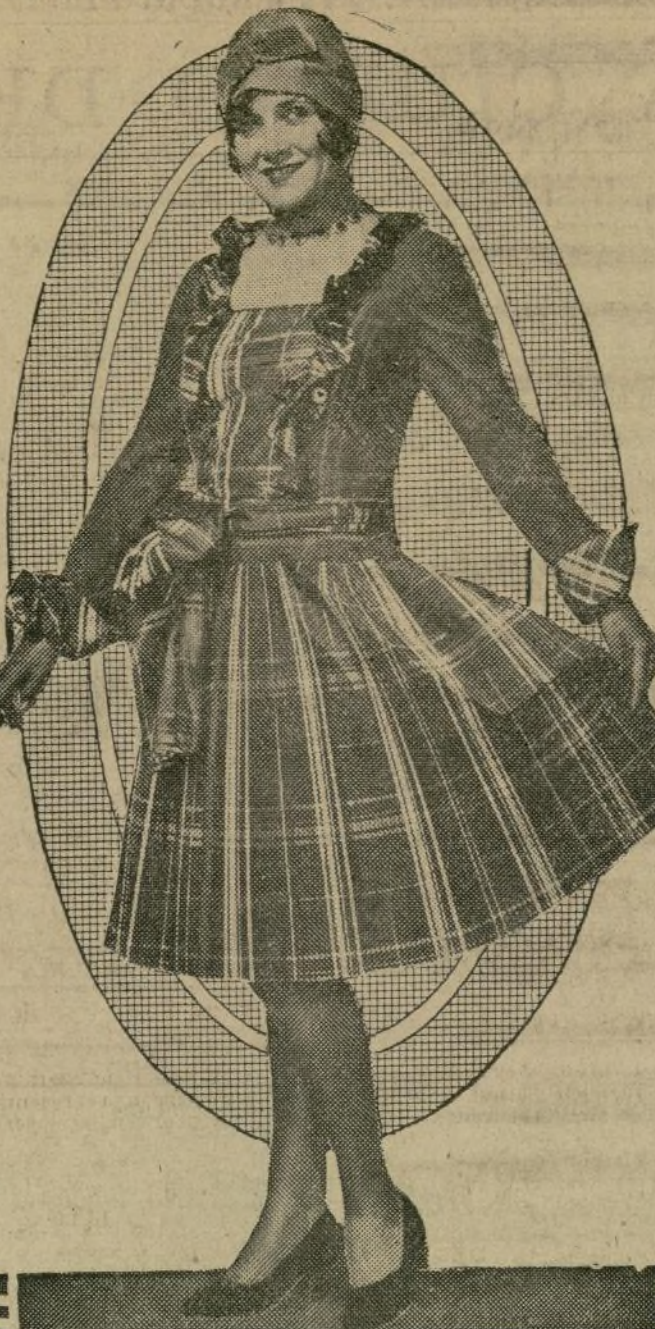
La bella artista siente predilección por estas combinaciones de colores tan del agrado de los montañeses de Escocia. Este lindo traje es una acertada combinación de tafetán azul marino con listas blancas.