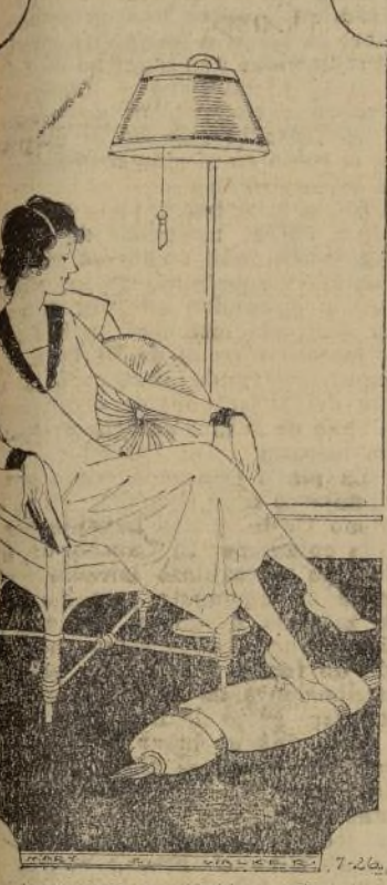
En un hogar que se establece sobre la sólida base de carino mutuo y respetuosa convivencia es óptimo el resultado.

Carino es la fundación principal sobre la que se edifica el verdadero hogar. Un hombre y una mujer contraen matrimonio por la simple razón de que se aman o por lo menos así lo creen. Si ellos habitan en una casa de amplias proporciones o en una habitación que han alquilado