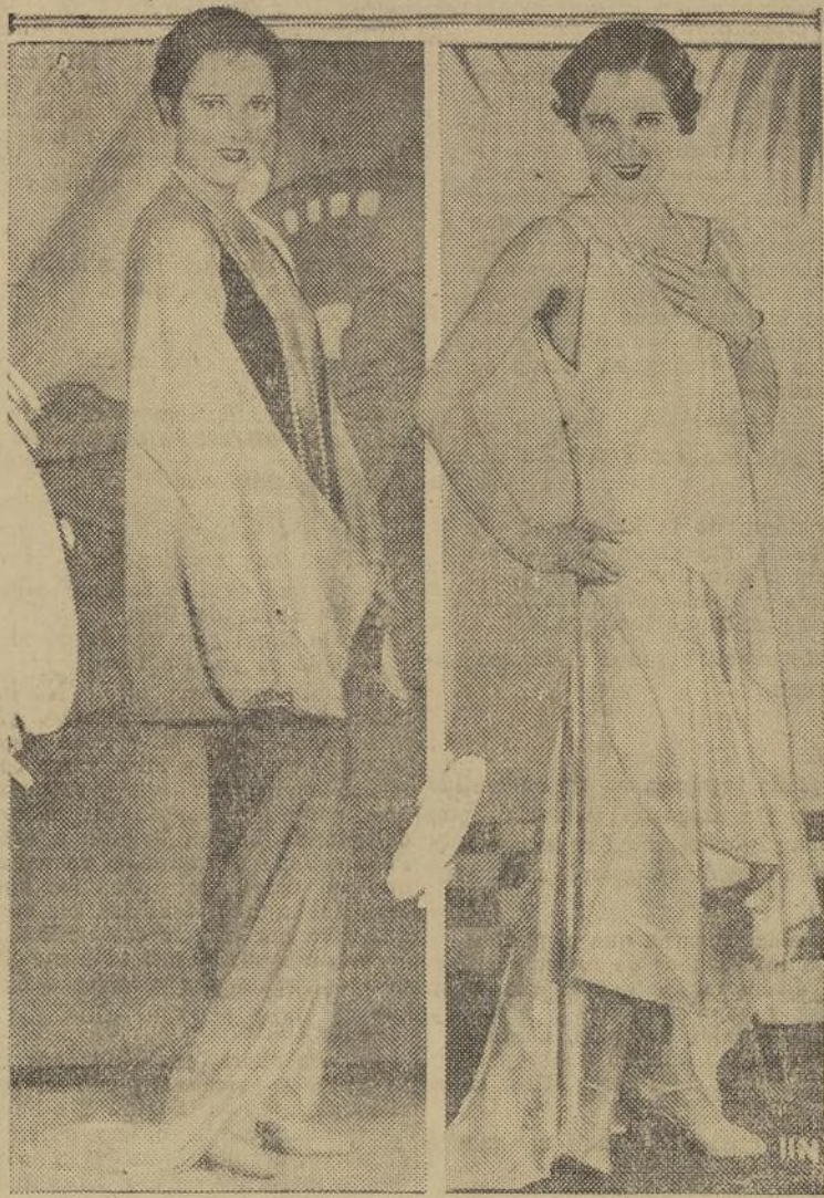
Mientras que por un lado véase marcada tendencia a dejar a un lado "todo estorbo", tal como mangas, etc., por el otro parece ir ganando terreno la idea de añadir al lujo con una cantidad considerable de tela.