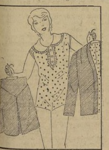
disto, el cual está confeccionado con arreglo a las últimas exigencias de la moda, que tan a menudo suele cambiar de parecer.

Peg está muy contenta y entusiasmada con el vestido de tres piezas que acaba de entregarse su mo-