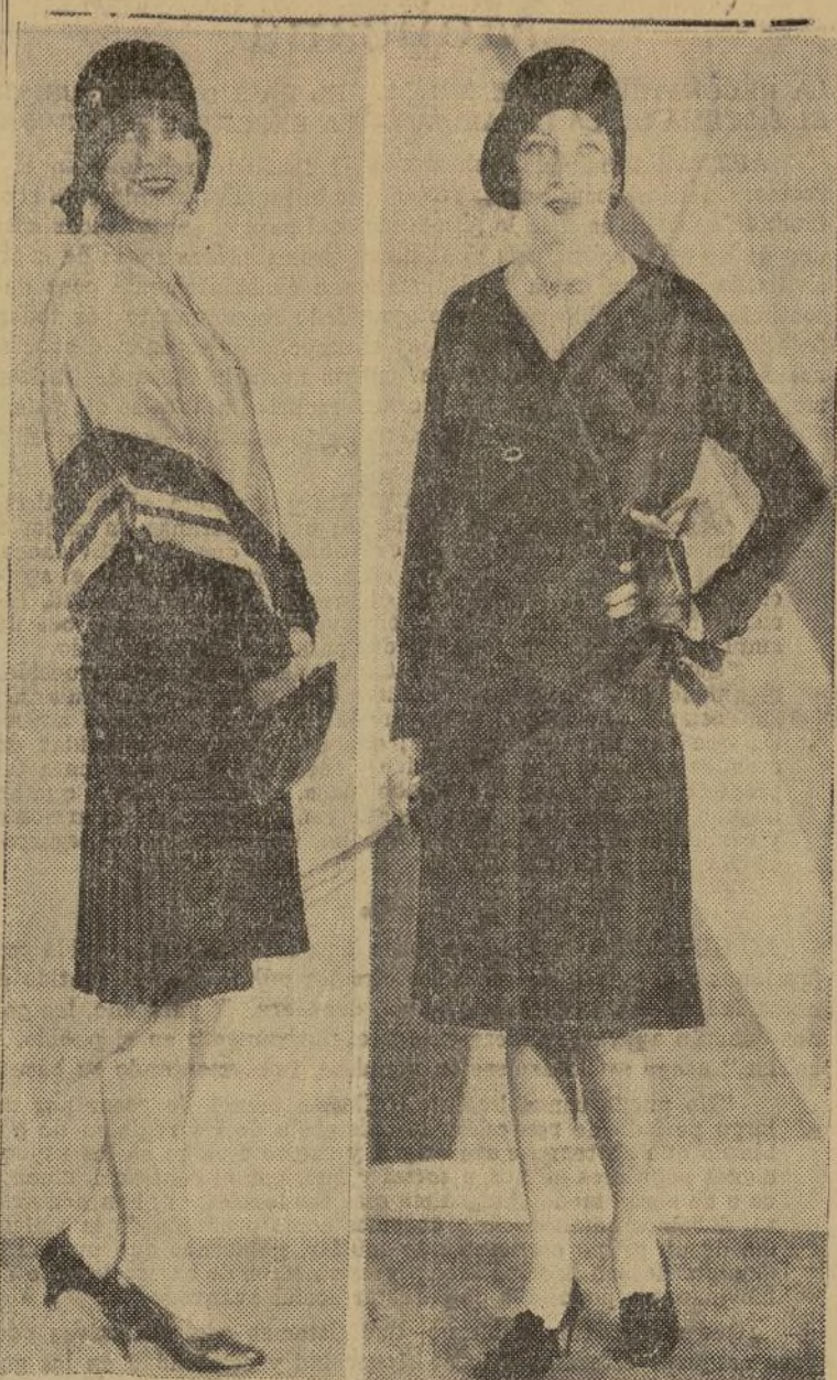
Dos modelos que han llamado poderosamente la atención por decirse son la última palabra en el arte de vestir y expresar acertadamente la síntesis de la elegancia femenina.