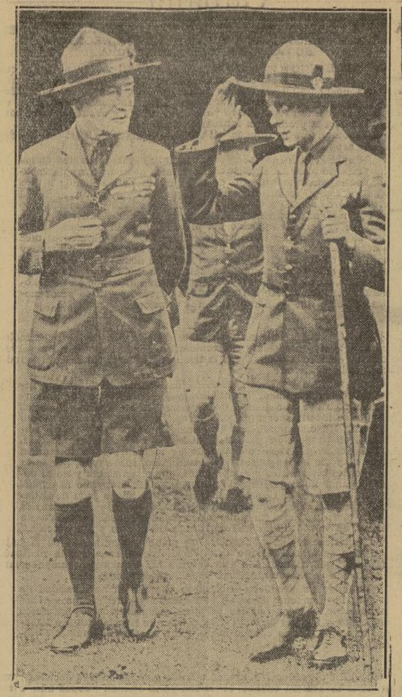
El príncipe de Gales visitó recientemente el campamento de los boy scouts que de todos los países del mundo se han reunido en Birkenhead, Inglaterra. En esta fotografía aparece luciendo el uniforme de aquellos. El otro personaje que le acompaña es Sir Robert Baden-Powell.