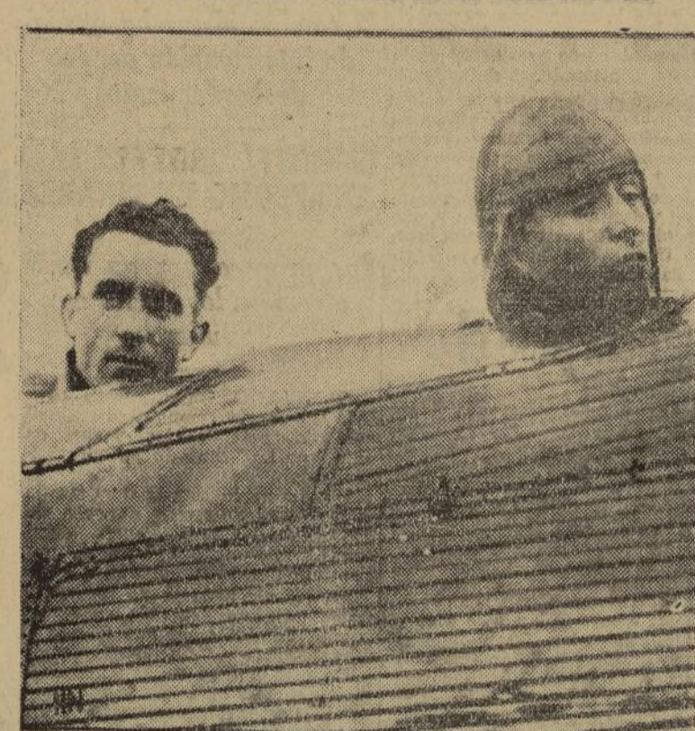
Dieudonne Costes (derecha) y Maurice Bellonte, célebres aviadores franceses, piensan intentar de nuevo la travesía del Atlántico a bordo de su avión "The Question Mark", a pesar de las dificultades que hallaron recientemente en su último intento, que les obligó a regresar a Francia cuando ya habían llegado a las islas Azores.