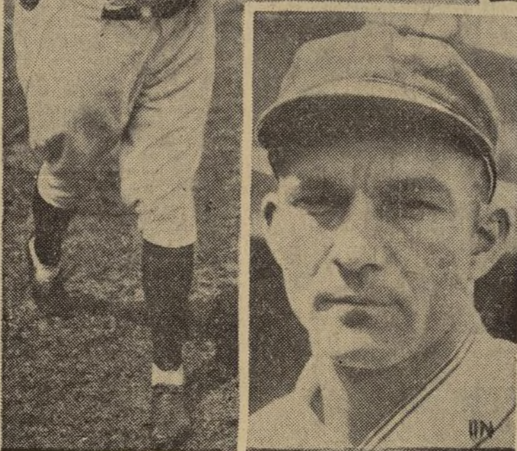
Kiki Kuyler (izquierda), un descartado de Pittsburgh, y Riggs Stephenson (derecha) son dos de los mejores "jardineros" que han tenido los "Cubs" de Chicago. No permiten que nada que se parezca a una pelota se les escape, a menos de que se trate de un verdadero "hit." Y a pesar de ello, cuando habéis con cualquiera de las razones por las cuales los "Cubs" están tan arriba, no dejéis de mencionar a estos señores.