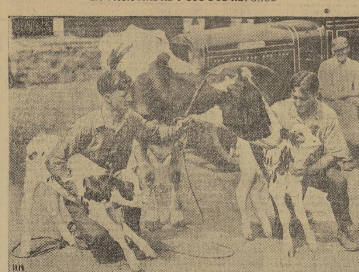
Aunque parezca raro tratándose de un ejemplar de la raza bovina, la vaca que aparece aquí, cuyo nombre es "Bossy", acaba de tener dos nuevos retoños a un tiempo y esta es la segunda vez que lanza al mundo una pareja de gemelos en el término de tres años. La protagonista se alimenta en las dehesas privadas de Elmhurst, L. I.