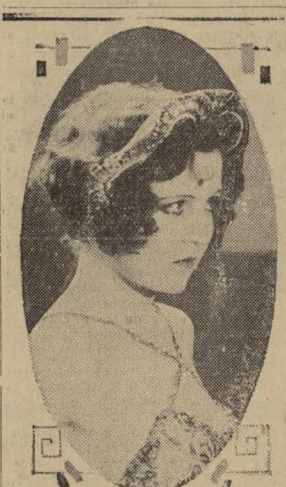
La encantadora Nancy Carroll, quien se adjudicó el "Rivoli" como protagonista de "Dance of Life", a la salida de Dolores del Río en "Evangeline".

La que este escritor cruzó el puente de Brooklyn y vio a Mr. Cohan y su compañía en el hermoso teatro de Louis Werba, encontrando am-