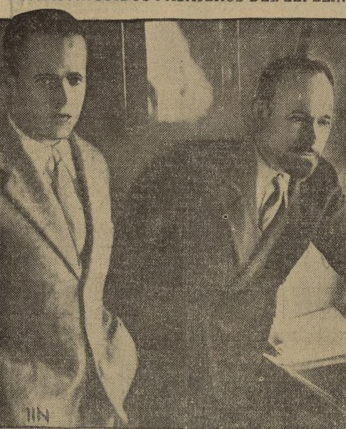
El capitán Sir Herbert Wilkins y William B. Leeds, contemplando el panorama que se divisa desde la barquilla del gran dirigible durante su viaje alrededor del mundo. El capitán Wilkins, como se recordará, no por el océano antártico.