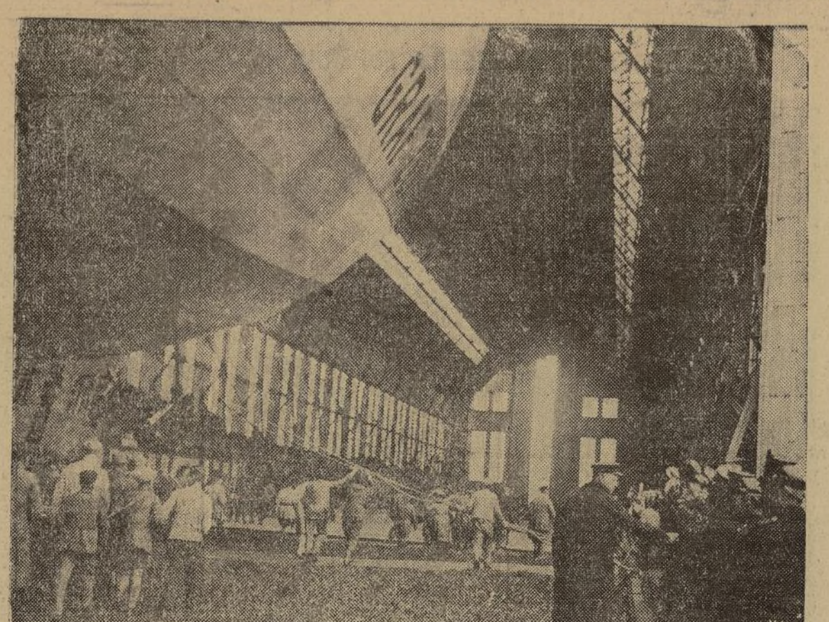
Rumbo a Los Angeles, California, el gigantesco "Graf Zeppelin" ha salido ya de Tokio, Japon, después de haber llevado a cabo la etapa que se consideraba la más peligrosa, dadas las características de las regiones que debía atravesar. Esta fotografía fué tomada poco tiempo después de su aterrizaje en Friedrichshafen, Alemania, al terminar la primera parte de la vuelta al mundo.