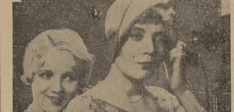
Lois Wilson ha sido siempre una mujer encantadora, pero no tanto como en su última cinta, "The Gambler", que se estrenó esta semana en el "Mark Strand".