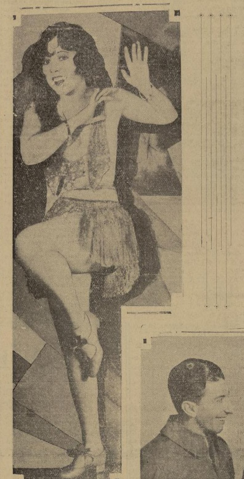
Ann Pennington, la popularísima bailarina neoyorquina, hace su debut cinematográfico en la cinta "The Gold Diggers", producción de los hermanos Warner, que se estrenará en el "Winter Garden".

ESTENOGRAFAS, estén o no empleadas: publiquen en LA PRENSA un anuncio clasificando. Tendrán abundantes contestaciones. Las que trabajen pueden mejorar su situación. No publiquen nombre ni domicilio. Pueden hacer dirigir las respuestas a nuestra oficina.