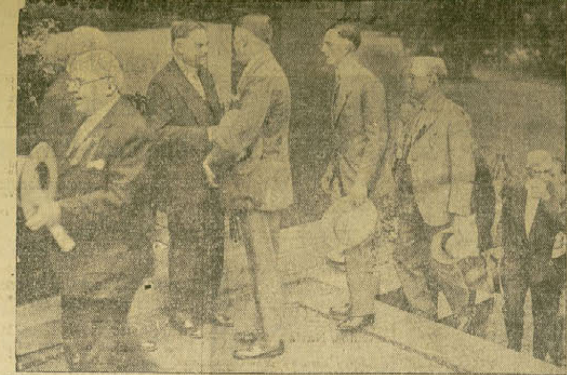
Gran parte de las actividades electorales este año centra en derredor de los agricultores. Herbert Hoover, candidato republicano, aparece aquí en el momento de conferenciar con una delegación de campesinos.