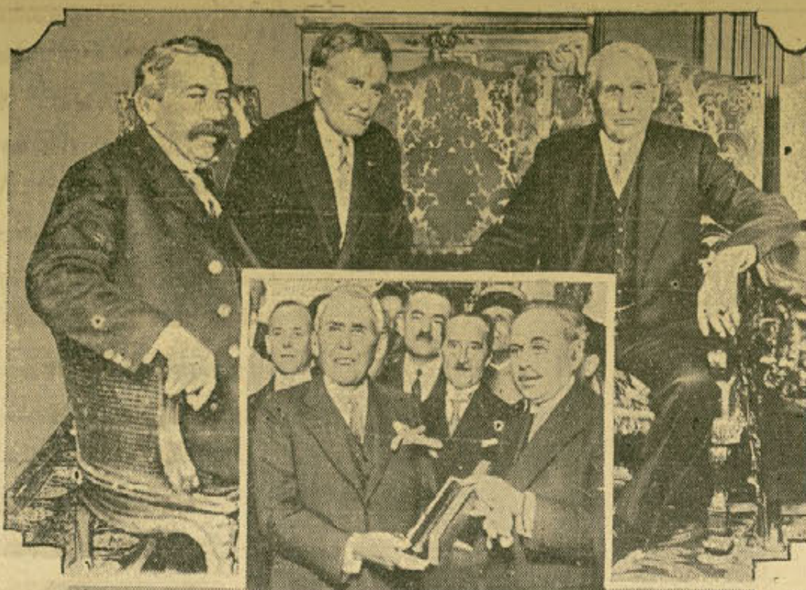
Esta fotografía presenta a un grupo de diplomáticos que recientemente se reunieron en París para firmar el ya famoso pacto antibélico Briand-Kellogg.