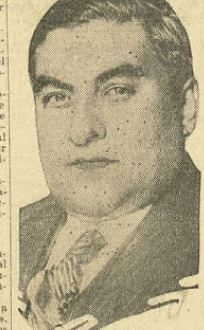
Licenciado Emilio Portes Gil