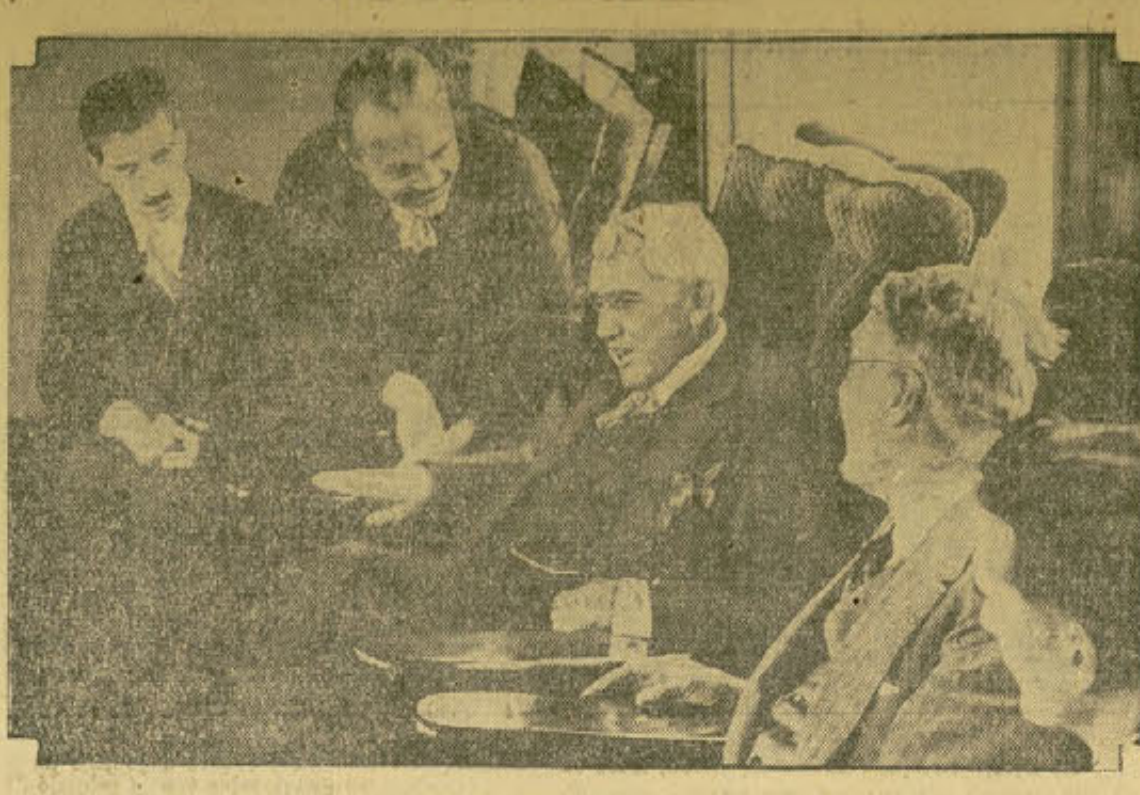
Los periodistas franceses tuvieron que "asaltarlo" el tren en que viajaba Mr. Kellogg mientras en Francia, para poder conversar con él un rato. Esta fotografía fue tomada en tal ocasión.