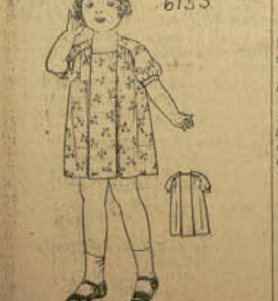
6153 elegancia y distinción. Los pliegues que bajan de arriba abajo, dan la suficiente amplitud y el pequeño canesú, que forma las mangas y

No. 6152. Delicioso vestido para niño. En crepón de china, en vuelo, o en seda, este modelito es de gran