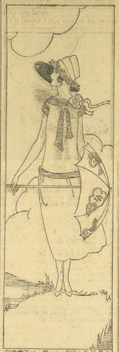
El vestido de verano que llevamos a nuestras vacaciones de septiembre debe convertirlo al mismo para los usos de "sport", que para más vestir.

es tan confortable para ponerlo en los pies cuando se duerme, como una botella de agua caliente, colocándole entre las sábanas y abrigando los pies.