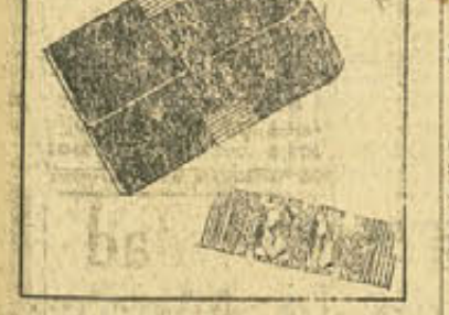
monedas de piel de suela la cual se destaca bellísima en medio del negro intenso del bolsillo, la hebilla tiene una serie de brillantes adornos con burbujas de negro onix. Una cinta de grogrén negra va cosida al rededor del portamonedas simulando el asa del mismo.

es tan confortable para ponerlo en los pies cuando se duerme, como una botella de agua caliente, colocándole entre las sábanas y abrigando los pies.