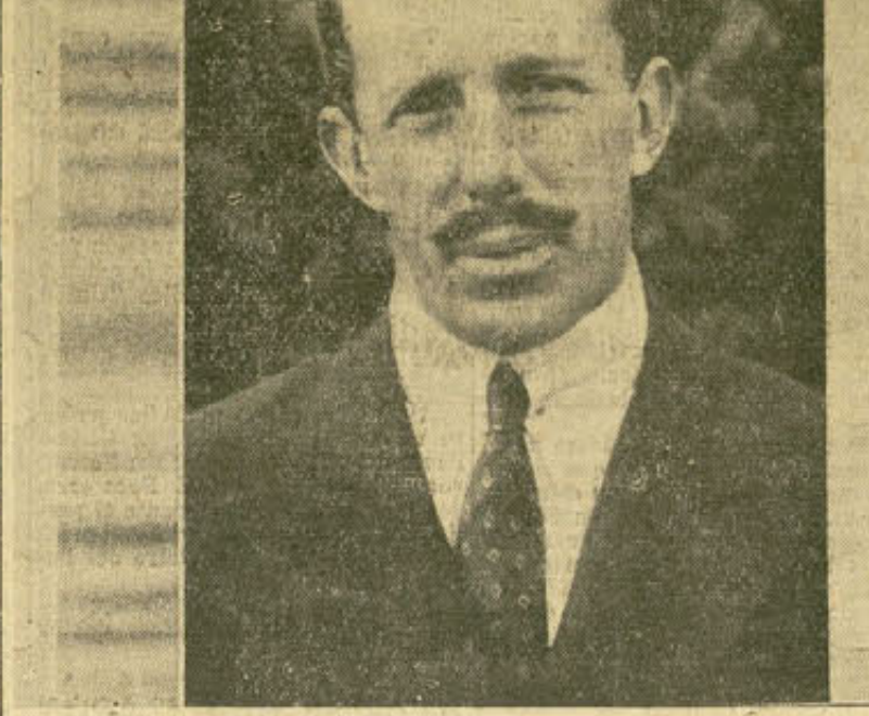
Un "close-up" del Rey Alfonso en la película parlanter de la Casa Fox. Al margen de la cinta aparece la franja de celuloide que registra el sonido de la voz del soberano.

Don Alfonso, que conserva durante todo su discurso un absoluto dominio de sí mismo, que llama hasta la familiaridad absoluta en varios