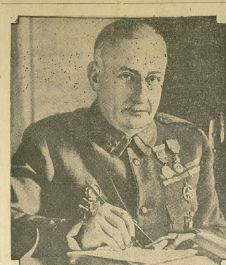
El presidente del Consejo de Ministros, general Primo de Rivera