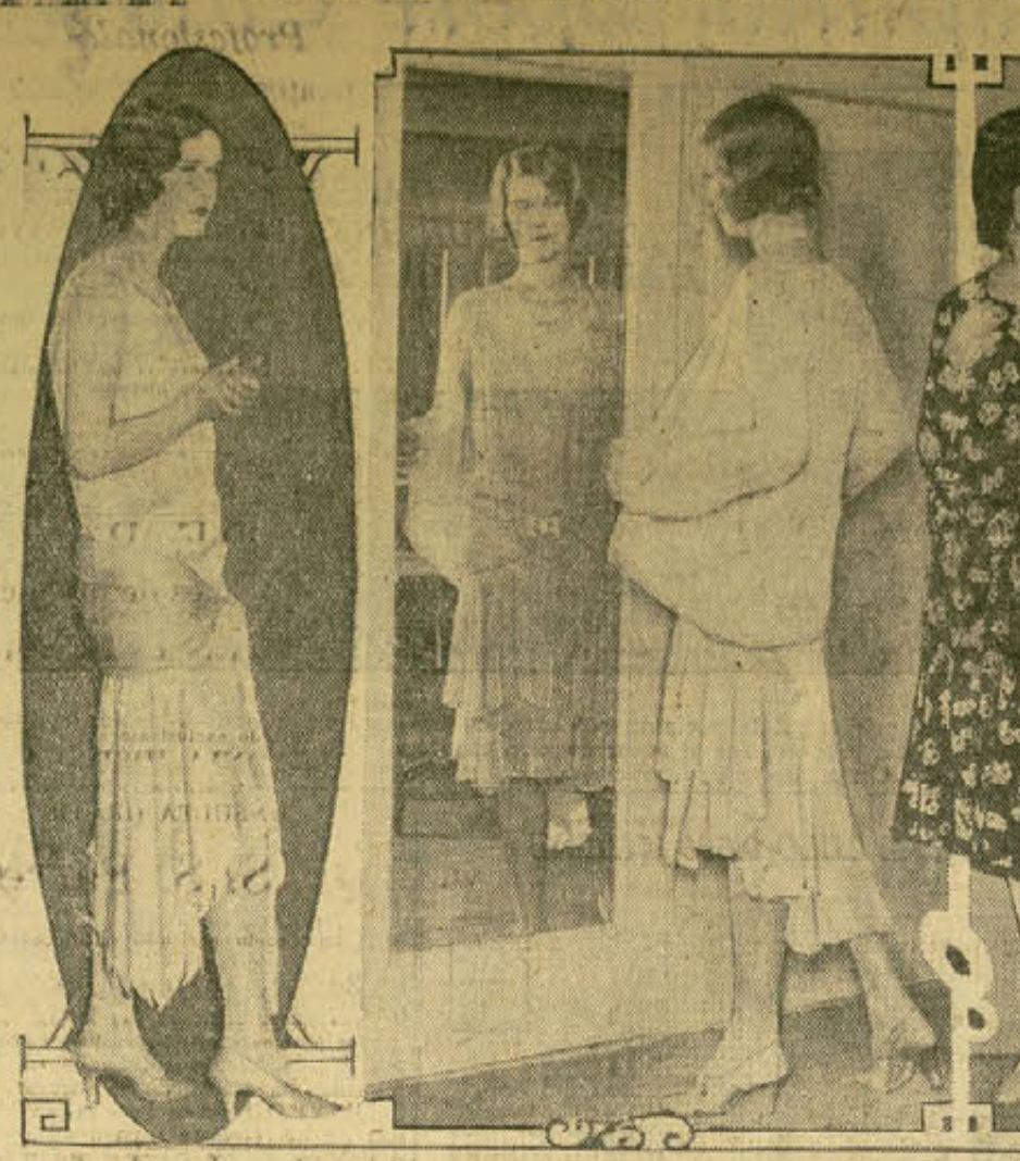
Estos bellos modelos, creación última de los modistos de París, marcan claramente la tendencia que existe hacia el retorno de los días en que las mujeres parecían usar vestidos.