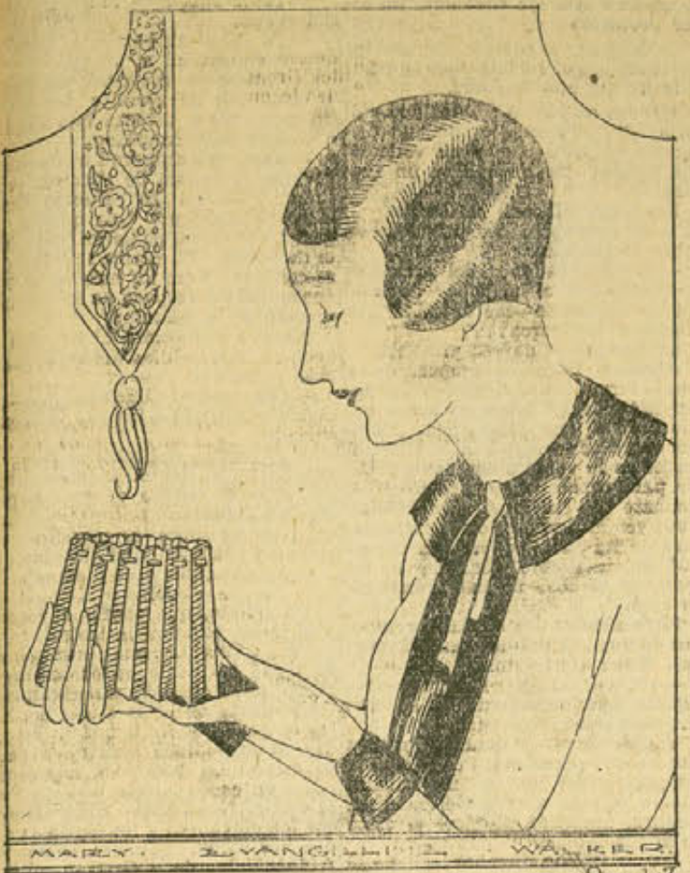
Infinitud de formas de pantallas son adaptables para hacer el estilo "lamp shower".

El nuevo estilo de pantalla conocido con el nombre de "lamp shower", es único y muy apropiado para servir de regalo a la muchacha que está a punto de casarse. Sus sombras enriquecerán el nuevo mobiliario de la casa y será