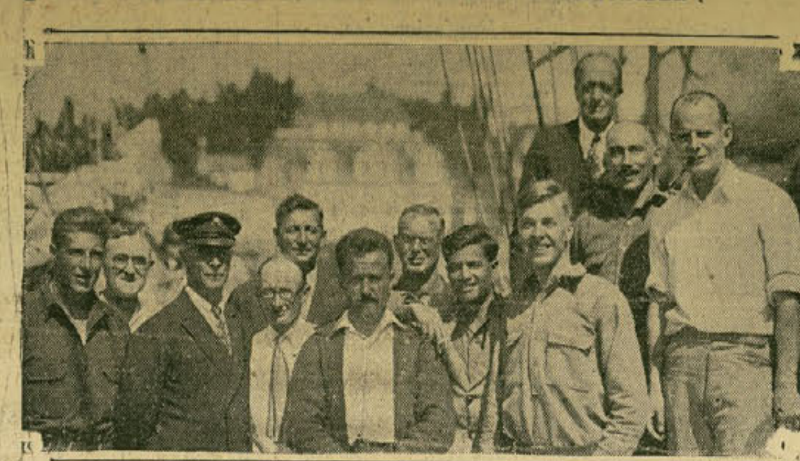
Después de haber realizado meritorios trabajos de exploración, la expedición ártica que encabezaba el comandante Donald McMillan (segundo en primera fila por la izquierda) se encuentra de nuevo en Nueva York.