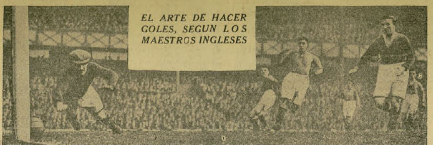
EL ARTE DE HACER GOLES, SEGUN LOS MAESTROS INGLESSES