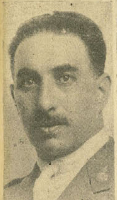
Comandante Benito Mola

MADRID, septiembre 17. (A).—El aviador español comandante Benito Mola, quien el año pasado estableció en las competencias internacionales Gordon-Bennett, en Detroit, Estados Unidos, ha sido encontrado muerto anoche en la barquilla de su globo aerostático "Hispania", a bor-