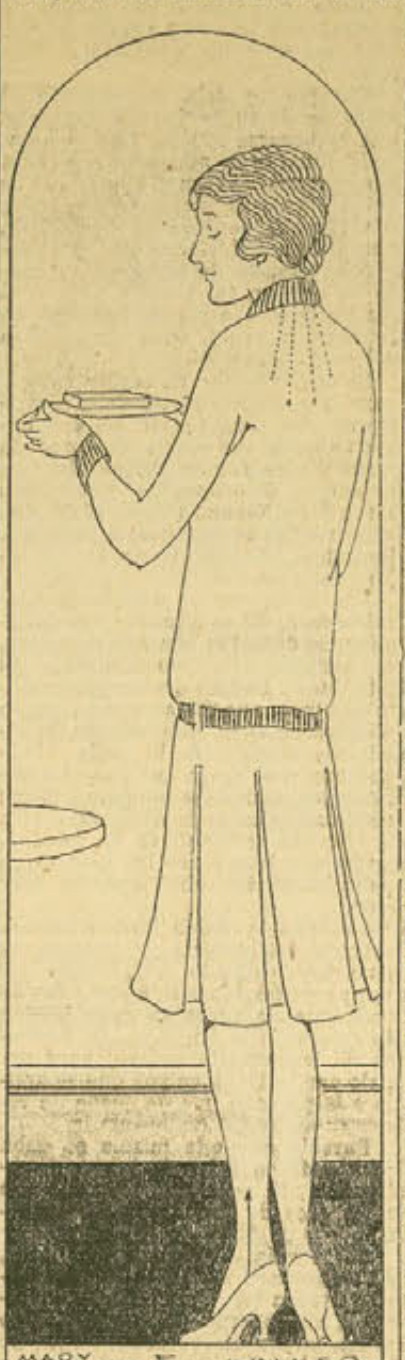
Si la manteca se va a guardar por un tiempo indefinido, puede esparcirse un poco de sal para su buena conservación.

cosa que ayuda mucho al trabajar la manteca es emplear una cuchara o espátula de madera; esto es tan