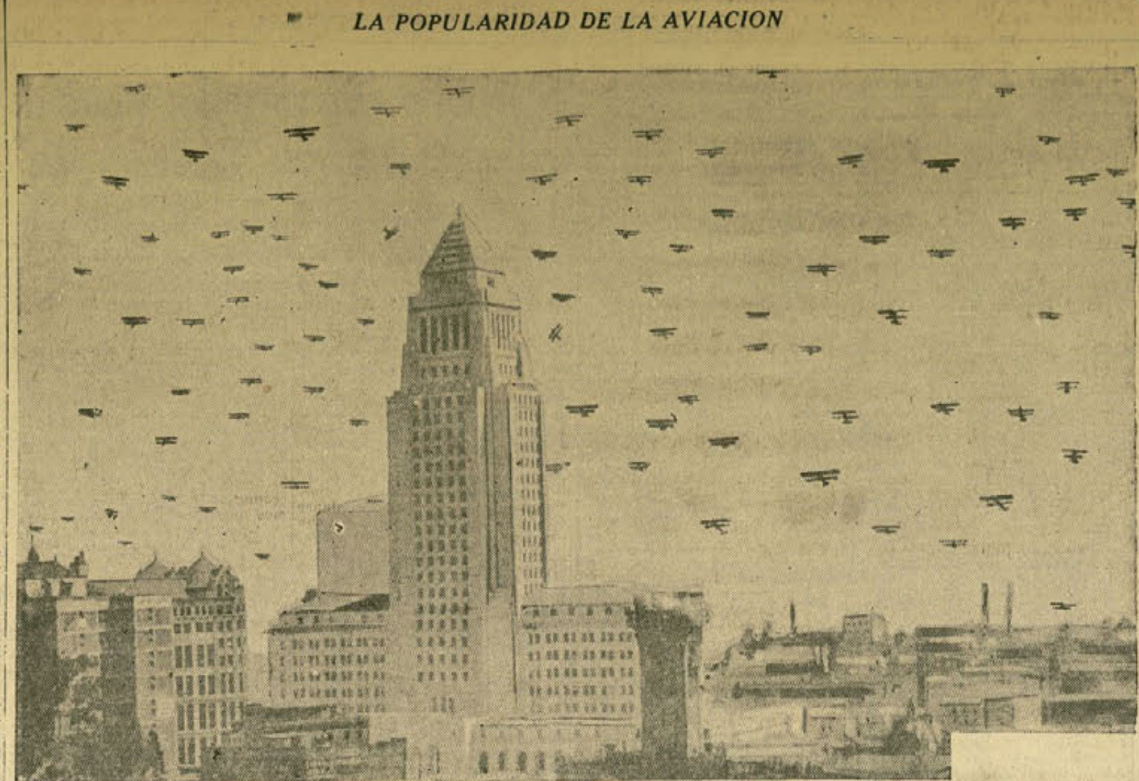
Esta fotografía, tomada durante recientes demostraciones aéreas en Los Angeles, California, da una idea aproximada del auge que va tomando la aviación, el medio de transporte del futuro, como alguien asegura.

Tan atareado en sus negocios que apenas ha tenido tiempo para presenciar algunos de los "match" importantes en Forest Hills, Manolo Alonso se encuentra en Nueva York desde el martes pasado tras su visita de varios meses a Sud América donde combinó el deporte con la ingeniería y obtuvo resonante triunfo en ambas cosas; de hecho había sido campeón de vencer en un partido individual. El gran tenista español se había inscrito por cable en la disputa de campeonato nacional individual, que ya final se jugó ayer en Forest Hills entre Francis Hunter y Henri Cochet, y debía haberse enfrentado a la primera etapa con Jean Borotra; pero no pudo participar en el torneo debido a que su barco arribó a Nueva York el día de ayer. Los aficionados del comienzo de la eliminatoria. Como a sus ocupaciones, quiz trascurren algunas semanas antes que pueda volver a reanudar sus actividades deportivas. Haga el bien sin que le cueste dinero. Abastézcase en casa anunciadas en LA PRENSA.