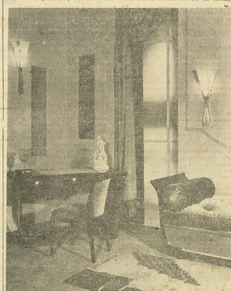
Parte del comedor, expuesto por Jules Lelen

mente en el piso octavo de la casa Altman, en la Quinta Avenida, es una impresión de armonía, de comunión fraterna, entre la acostumbrada estridencia que lleva en sí el arte de vanguardia y las tradiciona-