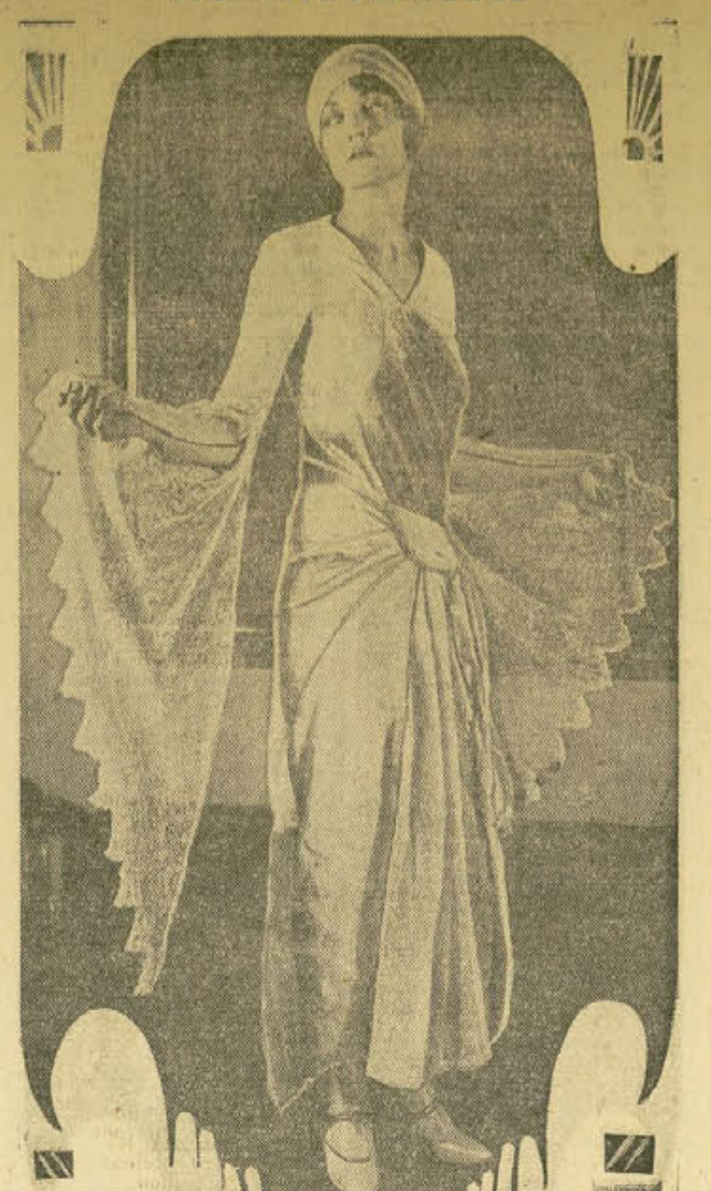
Ha llamado considerable atención en una exposición de trajes esta original creación de encaje blanco para las horas de tertulia.